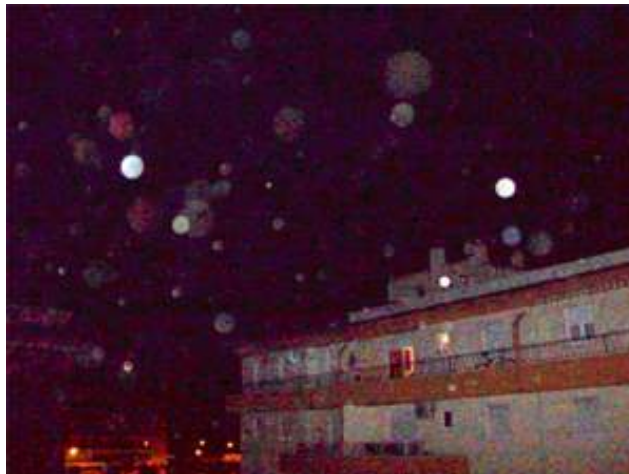
Foto 1 de 2. Esta misma noche, en el cielo de Granada después de la sesión de Púlsar Sanador de Tseyor.

Después de la meditación, Castaño ha realizado varias fotos al cielo oscuro de la noche, desde su terraza, y ha encontrado una sorprendente y brillante colección de xendras, de los cuales se adjuntan dos fotos. La abundancia de orbes o xendras es frecuente cada noche, después de la reunión en la sala, pero la de hoy es excepcional.