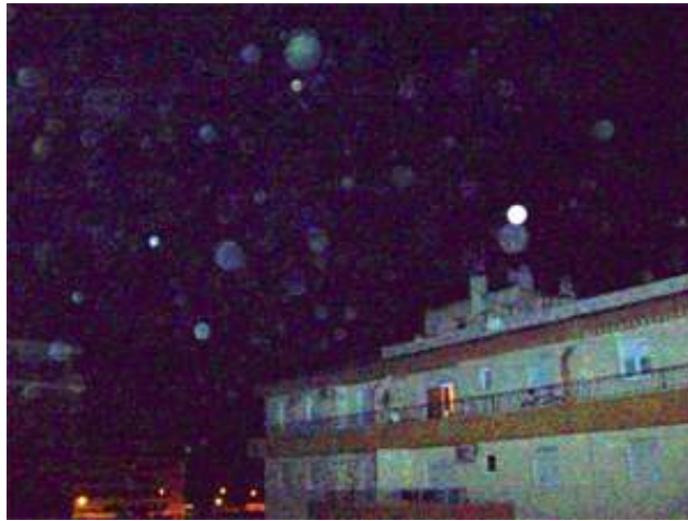
Foto 2 de 2. Granada después de la sesión de Púlsar Sanador de Tseyor.

Gracias a todos, y aprendamos a guardar respeto cuando estamos haciendo este trabajo de sanación. Así sea.