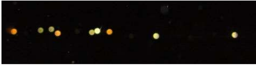
Convivencias en Lanzarote 2011. Esferas.