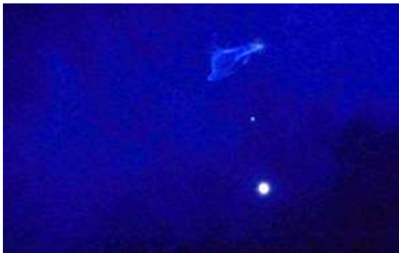
Foto nave plasmática de Tseyor obtenida en Barcelona-España en la convivencias Tseyor en Vallvidrera año 2006. Cielo completamente despejado y con Luna llena. Más información en el comunicado interdimensional Núm. 106 del 2/12/2006.

Y este elemento o nave interdimensional, en cualquier instante del tiempo y del espacio, si así es necesario, se magnificará en una composición atómica determinada, penetrando por espacios tridimensionales y ayudando a personas, incluso animales, a viajar hacia otros mundos.