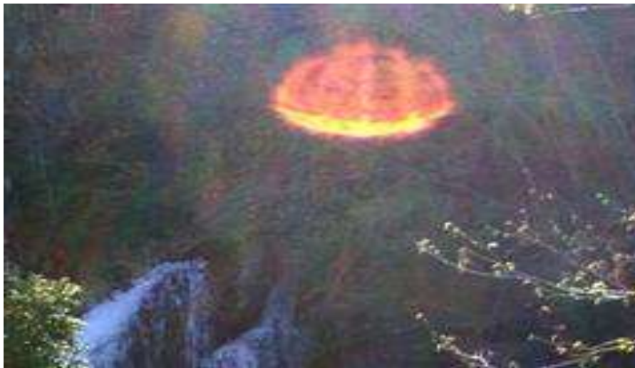
Foto módulo de titanio enriquecido, con capacidad para 4 ó 5 personas, junto al nacimiento del río Llobregat en Castellar de N'Hug, en Barcelona-España, con ocasión de las convivencias de Tseyor en 2008. A la izquierda de la imagen, sin aparecer, el grupo posaba para el recuerdo. Nadie se dio cuenta de la presencia del módulo, excepto el ojo de la cámara. Más información en el comunicado interdimensional Núm. 190 del 2/5/2008.

Por último, los ejercicios de extrapolación del pensamiento que hacemos con nuestros hermanos mayores están pensados precisamente para abrir los canales de teletransportación y acceso adimensional.