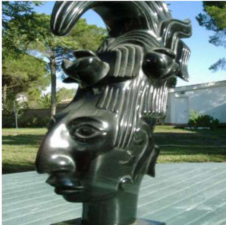
Escultura de un guerrero maya