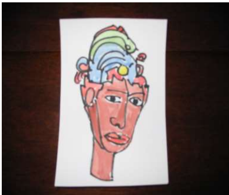
Burda reconstrucción de la apariencia de Aumnor de Ignus.

De nuevo regresé a mi cuerpo y me dormí. Y nada más. Un fuerte abrazo a todos de Puente.