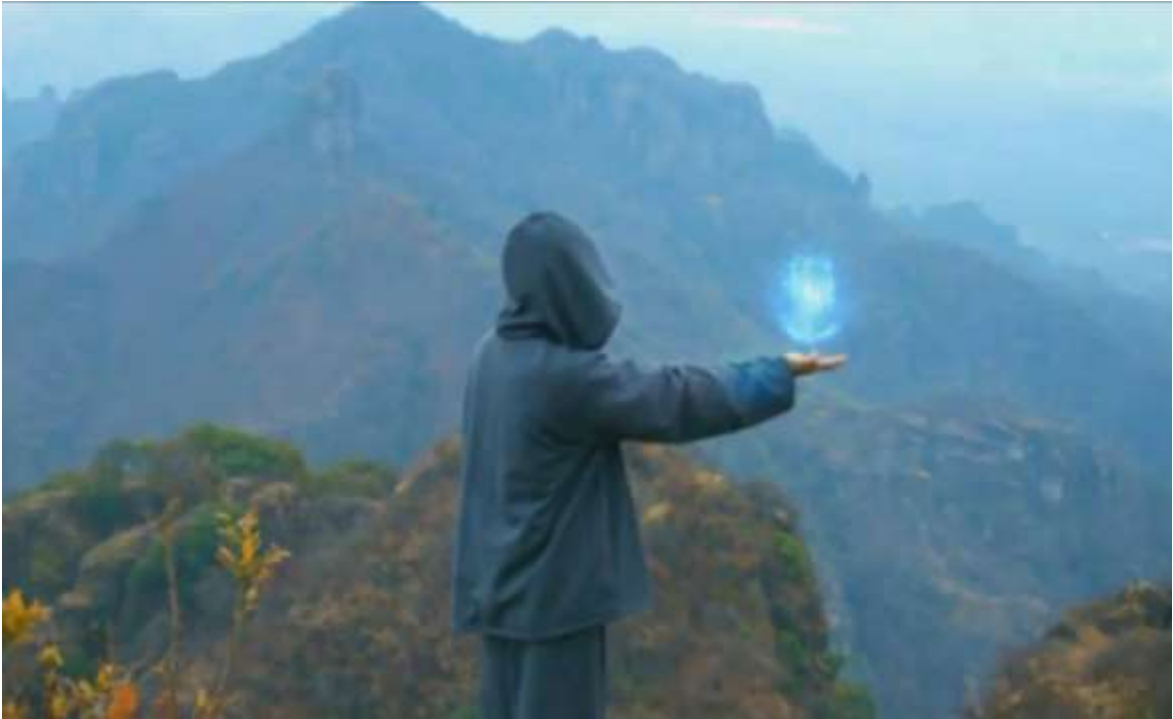
Foto esfera azul en la mano. Sincrónico y simbólico envío de Ilusionista Blanco PM, después de la presente conversación interdimensional con Shilcars, no sin preguntarse antes Ilusionista, ¿de qué sirve todo esto... tener la esfera azul en la mano?