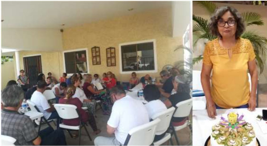
El grupo en una sesión de trabajo y a la derecha Síntesis La Pm, priora

Hoy hemos estado realizando el rescate adimensional de la visita a la Isla Venados. Después hemos estado leyendo y comentando el comunicado 1006 y Shilcars nos ha dado el siguiente comunicado.