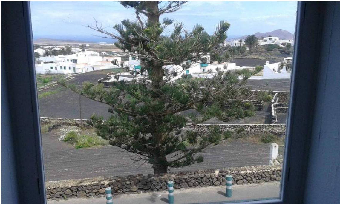
Gran araucaria que se encuentra enfrente del Muulasterio, vista desde la ventana con el mar al fondo.