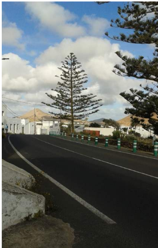
Pino frente al Muulasterio posición 28,8,43 recto hacia nuestra querida base submarina