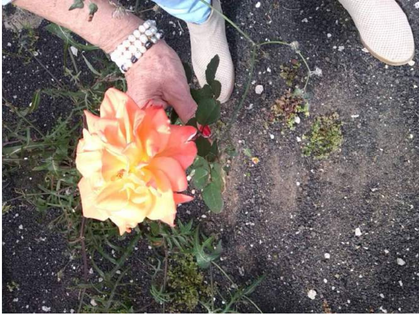
Espléndida rosa en el huerto del Muulasterio de Tegoyo en Tiagua