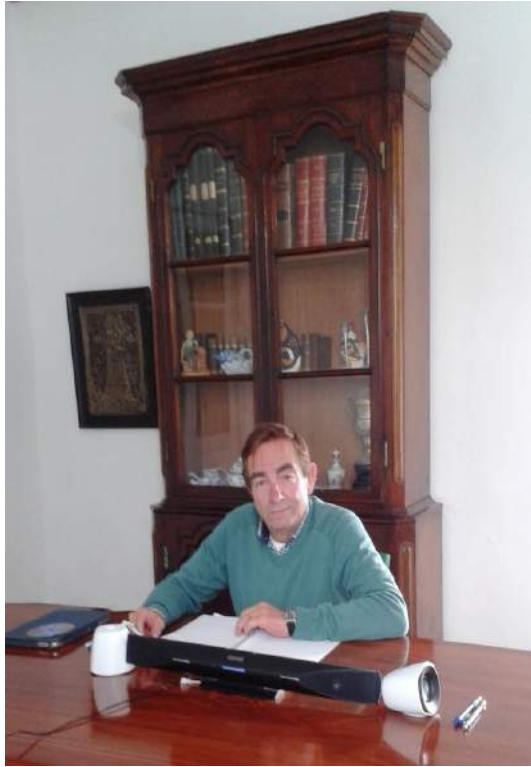
Nuestro canalizador Puente. Muulasterio Tegoyo