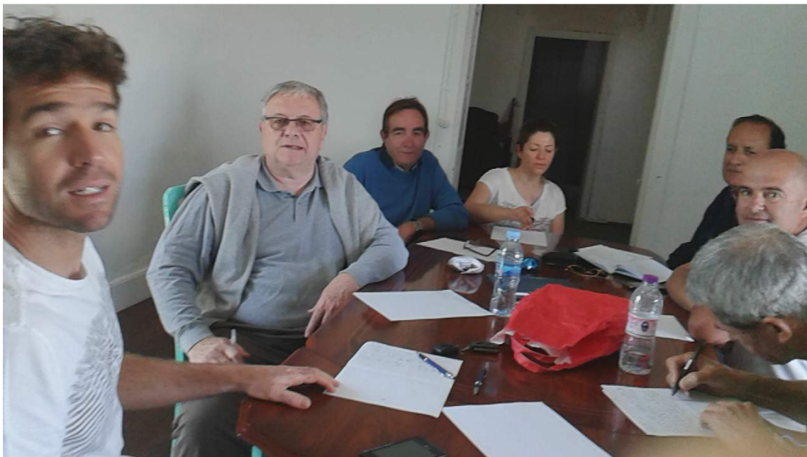
De izquierda a derecha: Esfera Musical Pm, Escribano Fiel La Pm, Puente, Capricho Sublime La Pm, Castaño, En Su Busca La Pm, Ayala.