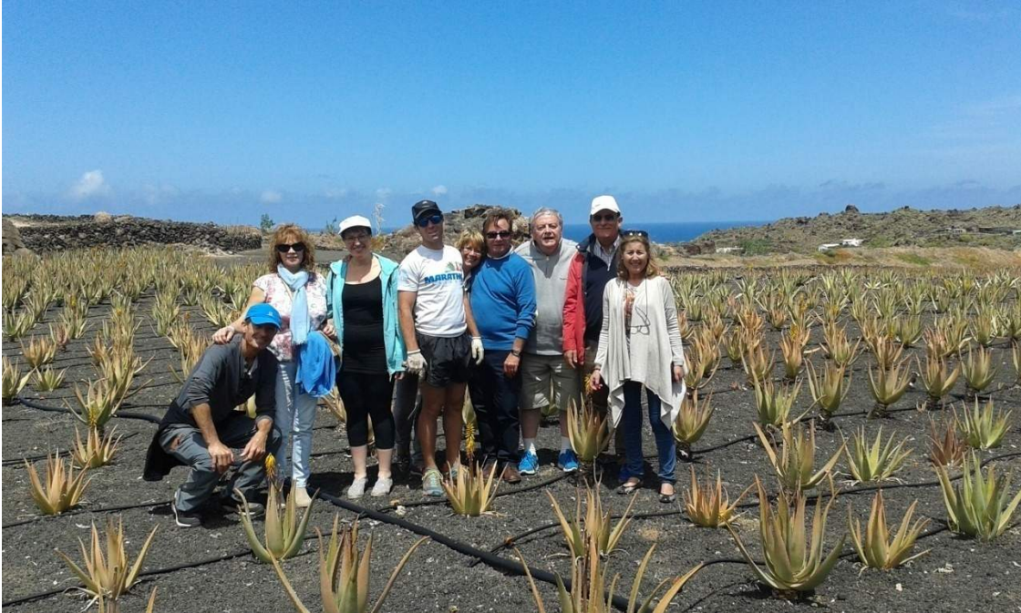
Visita de algunos de los asistentes a las convivencias a una plantación de aloe vera