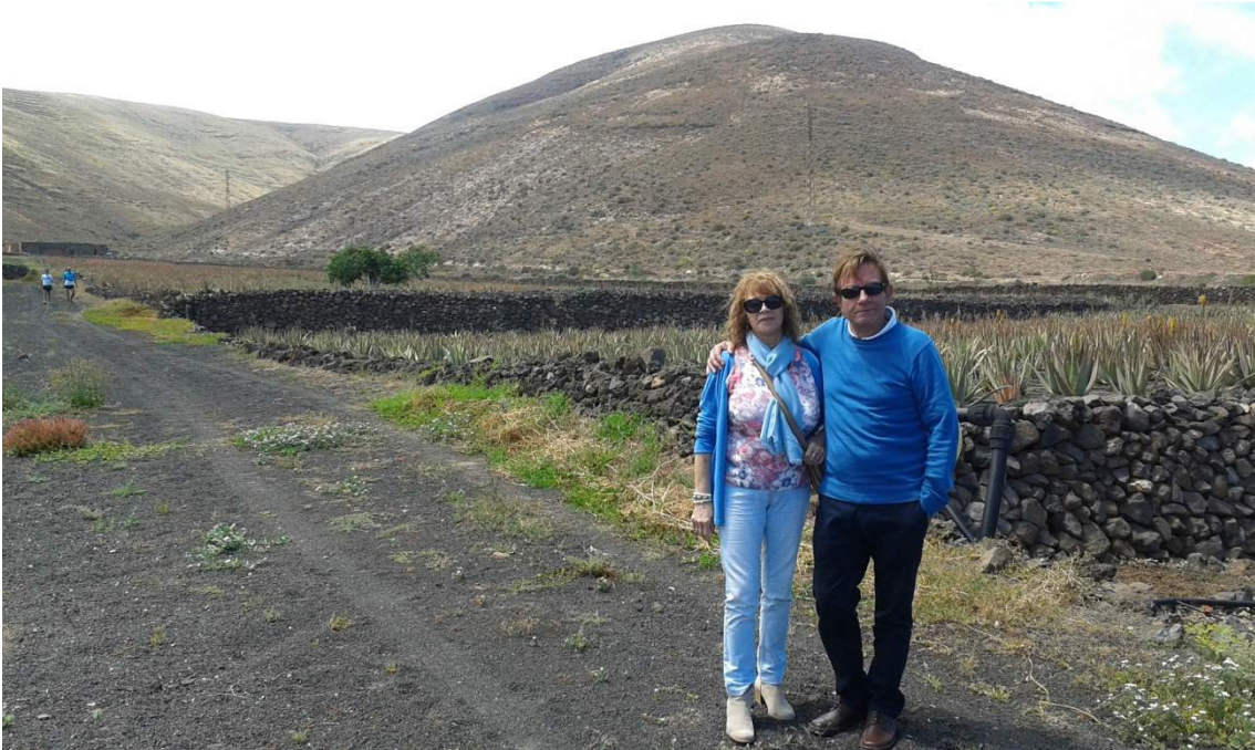
Sala y Puente. Convivencias Muulasterio Tegoyo. Abril 2015. Al fondo plantaciones de aloe vera.