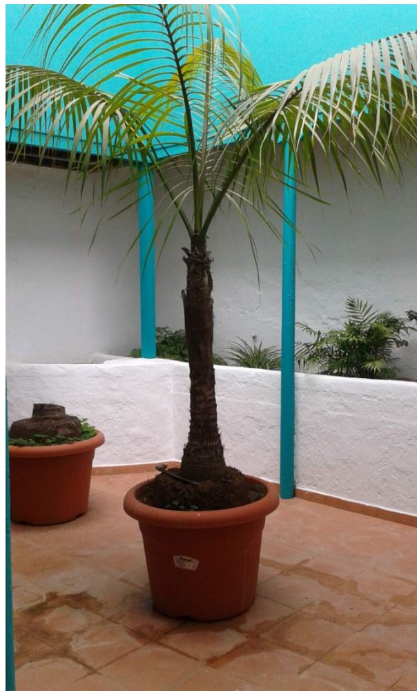
Esbelta palmera en el patio del Muulasterio