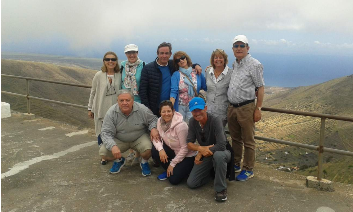
Arriba de izquierda a derecha: Escampada Libre La Pm, Especial de Luz La Pm, Puente, Sala, Dadora de Paz Pm, Castaño. Abajo de izquierda a derecha: Escribano Fiel La Pm, Capricho Sublime La Pm, Ayala.