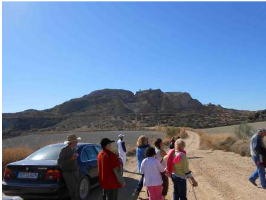
Camino de Montevives