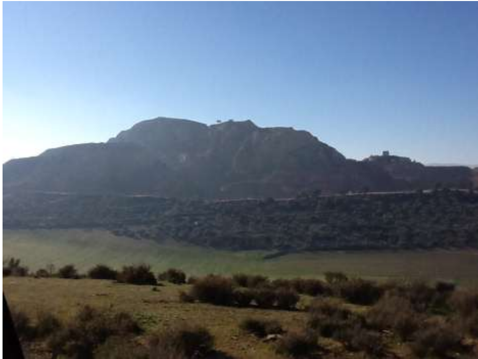
Cara norte de Montevives