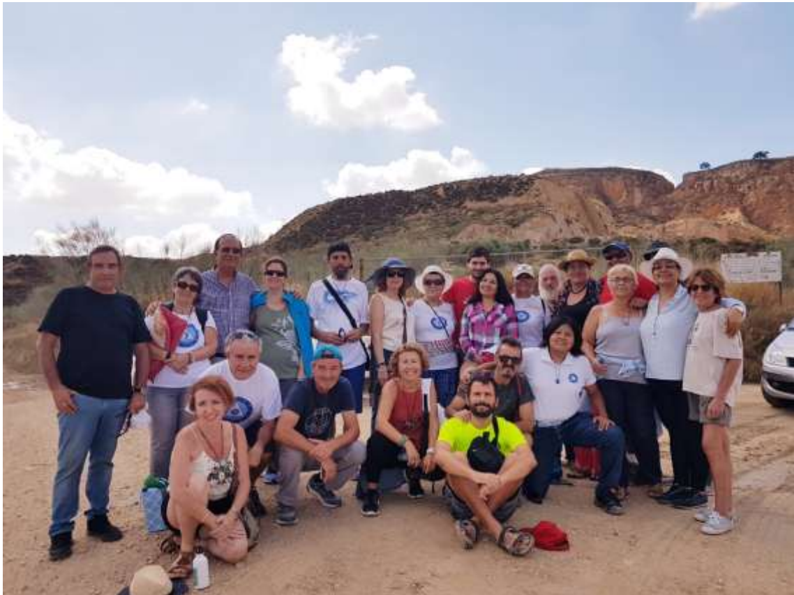
Los 24 asistentes a la visita a Montevives