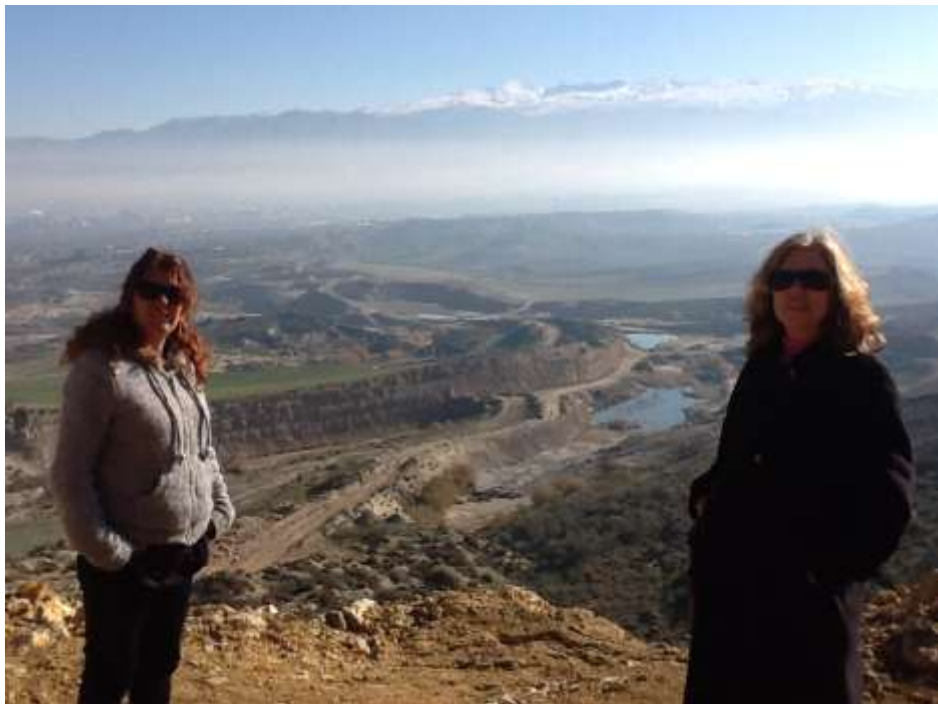
Vista de Sierra Nevada desde la cumbre de Montevives