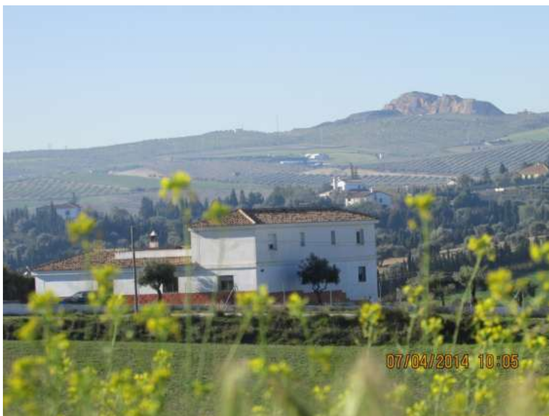
En primer término el Muulasterio La Libélula y Montevives al fondo