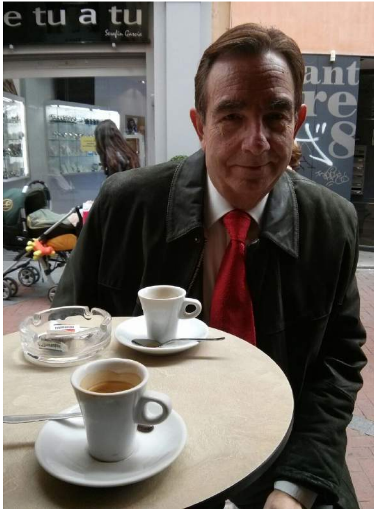
Barcelona - Marzo 2015