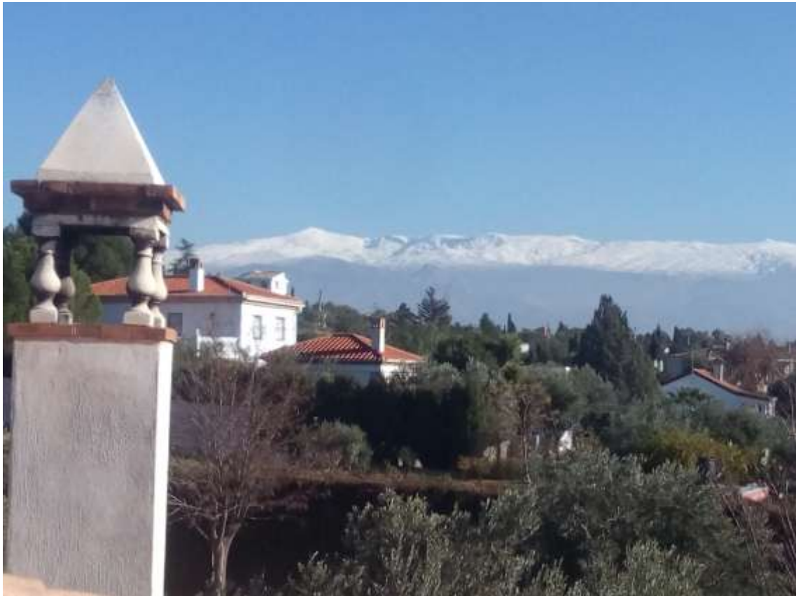
Sierra Nevada vista desde el Muulasterio Tseyor La Libélula

En la reunión de hoy viernes, hemos estado comentando en la sala del Ágora del Junantal las experiencias y trabajos que estamos realizando en estas convivencias. Habíamos pedido a Shilcars que nos diera un cuento de Navidad, como tantas veces ha hecho en las convivencias de diciembre en La Libélula, y nuestro hermano mayor nos complació ofreciéndonos el siguiente relato.