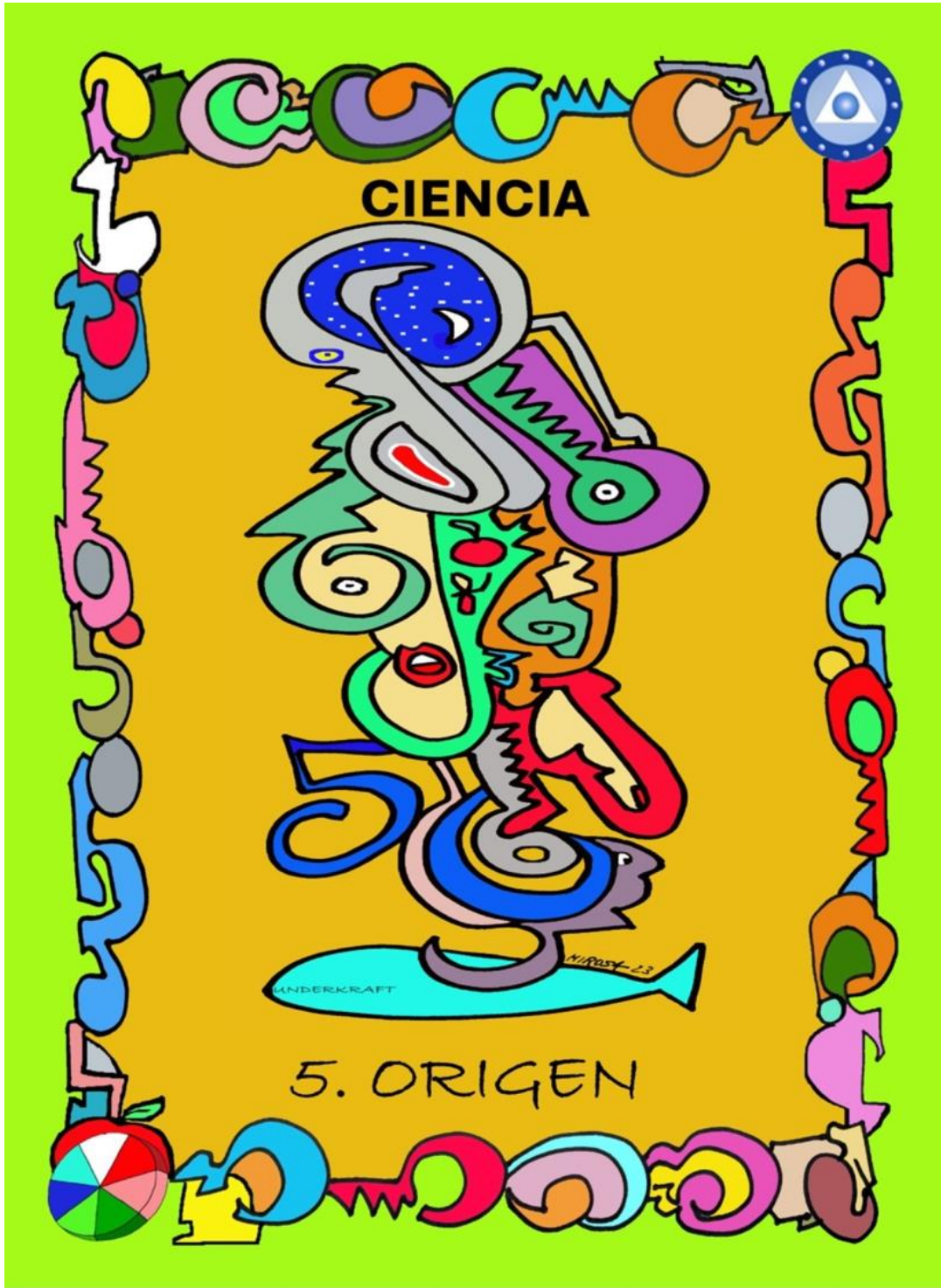
En carta nº 5 Origen, del juego de Cartas de Uommo , podemos ver a un viajero estelar que con su mano izquierda señala en un mapa del cielo su estrella de procedencia y con la mano izquierda sujeta la clave o la llave que le permite viajar por el universo.