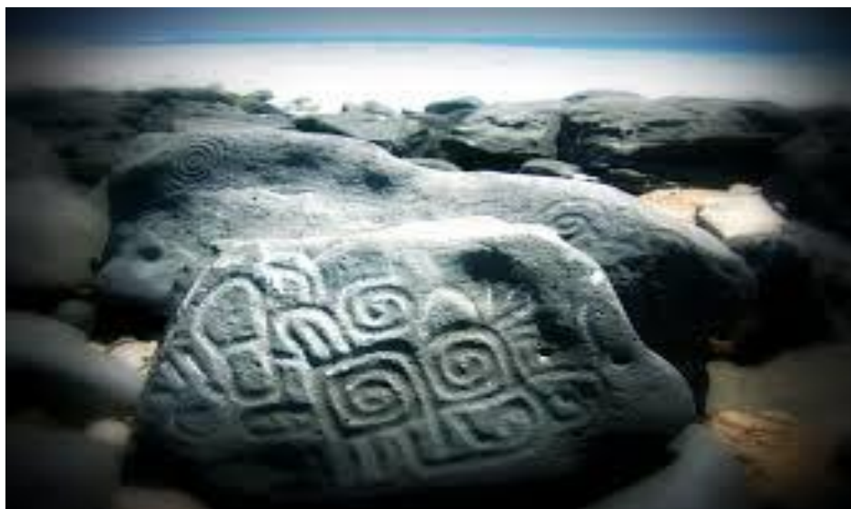
Petroglifos de la playa de Las Labradas, en Mazatlán

Permitidme que os explique un pequeño y breve cuento, tal vez así podremos ilustrar mucho mejor y de forma más rápida lo que Shilcars intenta transmitir. En el bien entendido de que es un cuento y como tal habremos de aplicarlo, pero como todos los cuentos tienen su fondo de realidad.