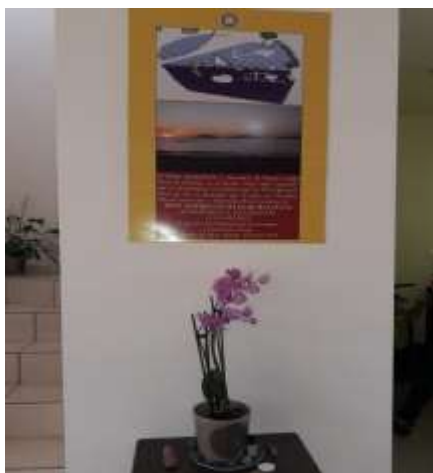
Foto arriba. En una pared del Muulasterio, un dibujo premonitorio y sincrónico muy antiguo de Puente, que coincide aproximadamente con una foto actual de la bahía de Mazatlán. Y además, vemos ahora una nueva sincronía, obsérvese en la parte de arriba a la izquierda de dicho dibujo el Pez, que simboliza el paso 3 del Tseek, previo a la fusión con el 33.

Desde el Muulasterio Los Máak de Mazatlán, nos envían las siguientes fotos con motivo de su primer aniversario.