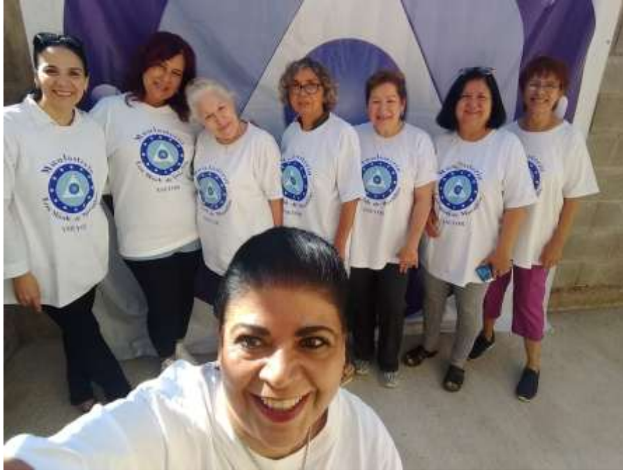
Nuestro bello Muulasterio Los Máak de Mazatlán, Sinaloa-México, celebrando con alegría el primer año de su fundación