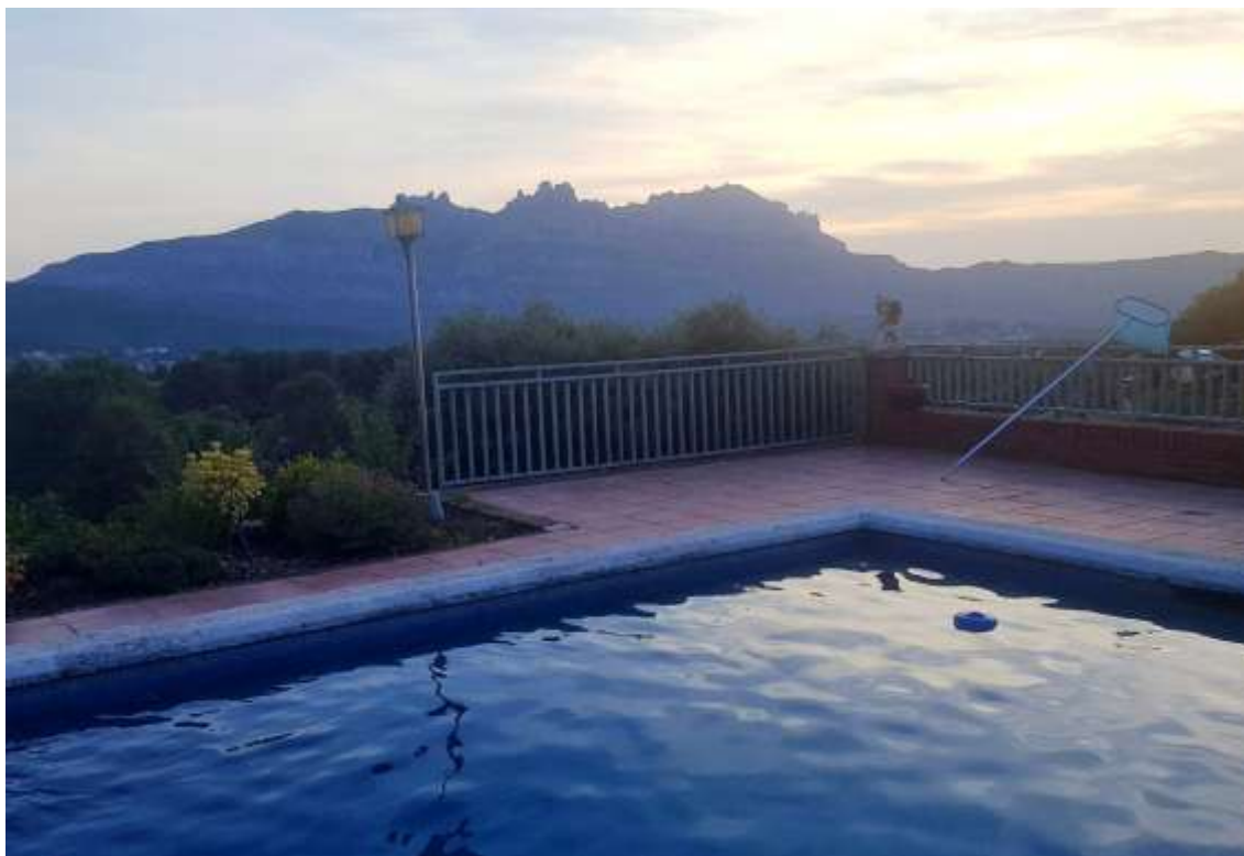
23/6/2019.- Al fondo y anocheciendo, la Montaña de Montserrat-Barcelona

Puente relata que es la víspera del día de San Juan, y esta noche se celebra la nit del foc (la noche del fuego). Irán a pasar la velada ante la mágica montaña de Montserrat.