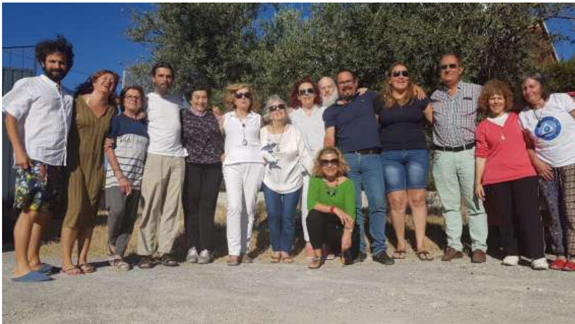
De izquierda a derecha: Pigmalión, Capitel Pi Pm, Con buen Sabor La Pm, El Bastón La Pm, Bien Dicho La Pm, Liceo, Canal Radial Pm, detrás Papa y Claro Apresúrate La Pm, agachada Escampada Libre La Pm, Con Buen Pie La Pm, En el Ojal La Pm, Castaño, Fácil es Hallarlo La Pm y Cantemos Juntos La Pm.

En la convivencia del Muulasterio Tseyor La Libélula, hoy sábado, por la tarde, hemos estado comentando nuestras impresiones sobre las convivencias, en el Ágora del Junantal. Shilcars nos ha dado el siguiente comunicado, seguido de la energetización de piedras, agua, semillas y elementos por parte de Aium Om.