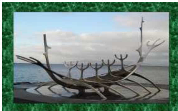
La barca de los pescadores

Cada pez que rescatéis de las profundidades del pensamiento, será una forma de explicaros a vosotros mismos que ha valido la pena ese despertar, traer la luz de este sentimiento amoroso en todas las mentes de este movimiento cósmico-crístico.