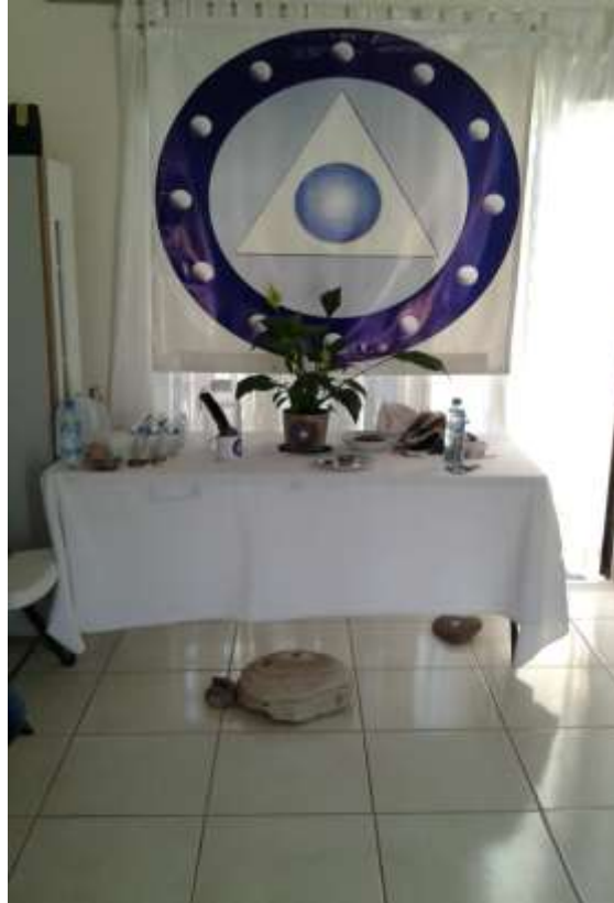
Sala del Muulasterio Los Máak de Mazatlán. En espera de la ceremonia de energización