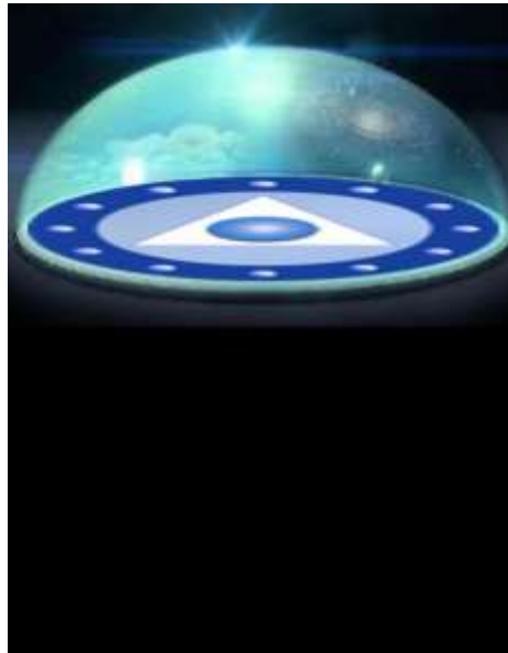
Símil de la nave de Noiwanak, con el sello de Tseyor en su base