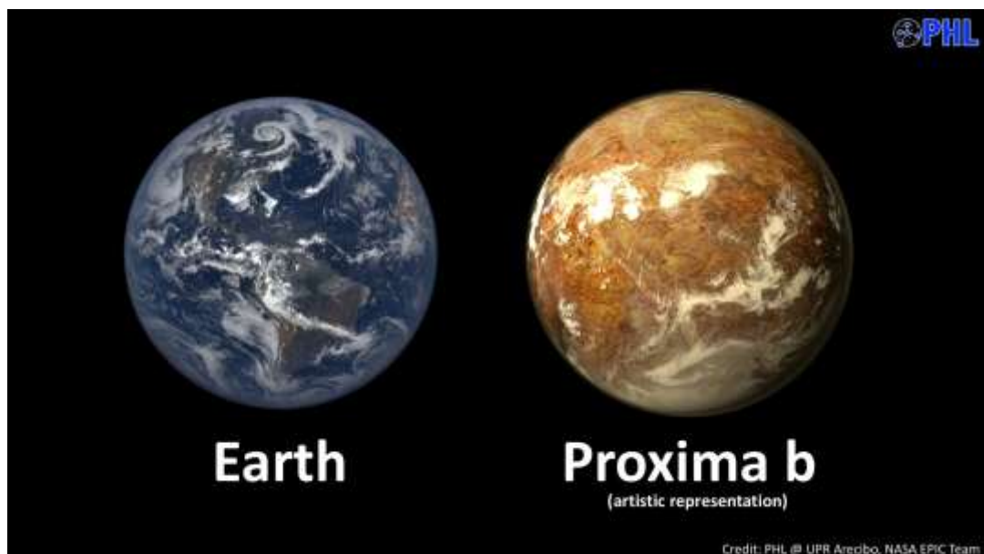
Representación artística de Proxima Centaur B en comparación con la Tierra

Sí, cuando hemos ido allí nos habéis recibido con mucho cariño. Gracias.