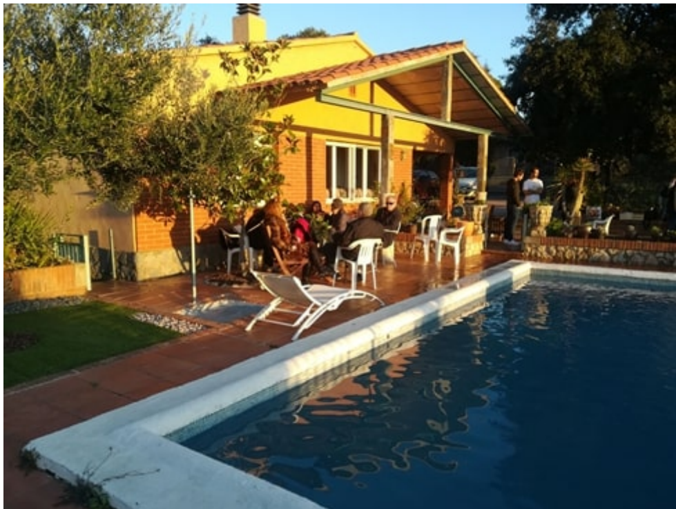
El grupo de Barcelona en el lugar del encuentro cerca de Montserrat

En ese aspecto, pues, comprendéis perfectamente lo que estoy indicando, y me gustaría subrayar que en realidad no estamos, ni estáis, en el mismo sitio. Porque, a diferencia de hace 40 años, en los que no se disponía de información, ahora es todo lo contrario.