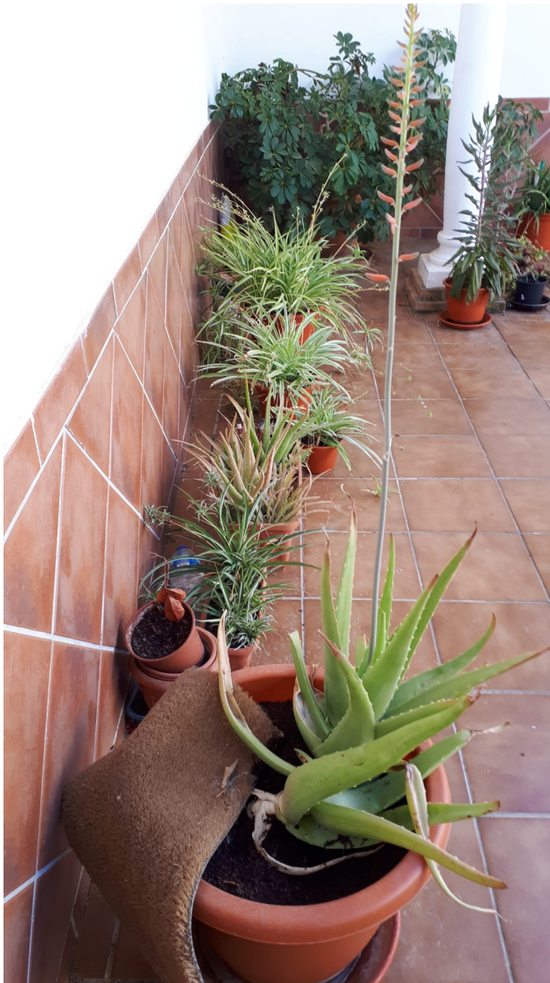
Flores en el Muulasterio Tseyor La Libélula.