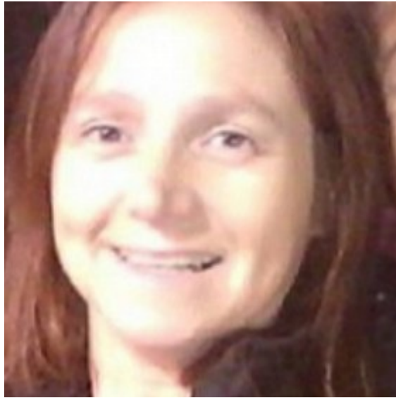
Colorea Copiosamente La Pm