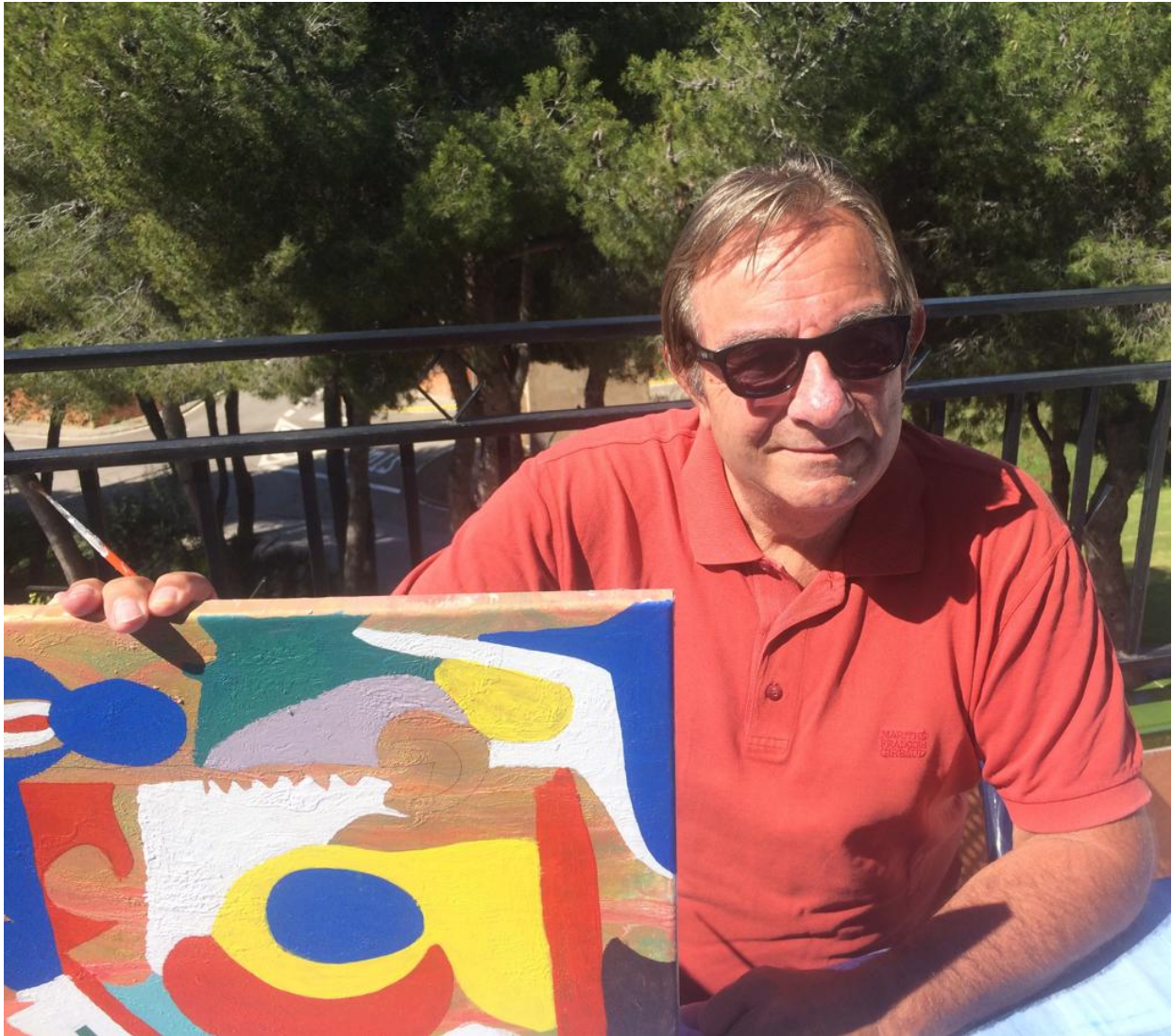
“Playa Cabellos Blancos. Confinado pero no parado. Titulo del cuadro: del caos nació nuestro universo. Abrazos. Puente”