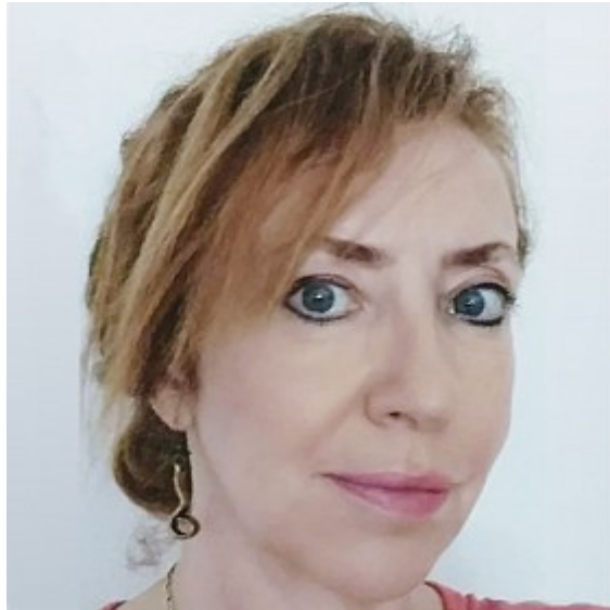
Empieza La Unión La Pm