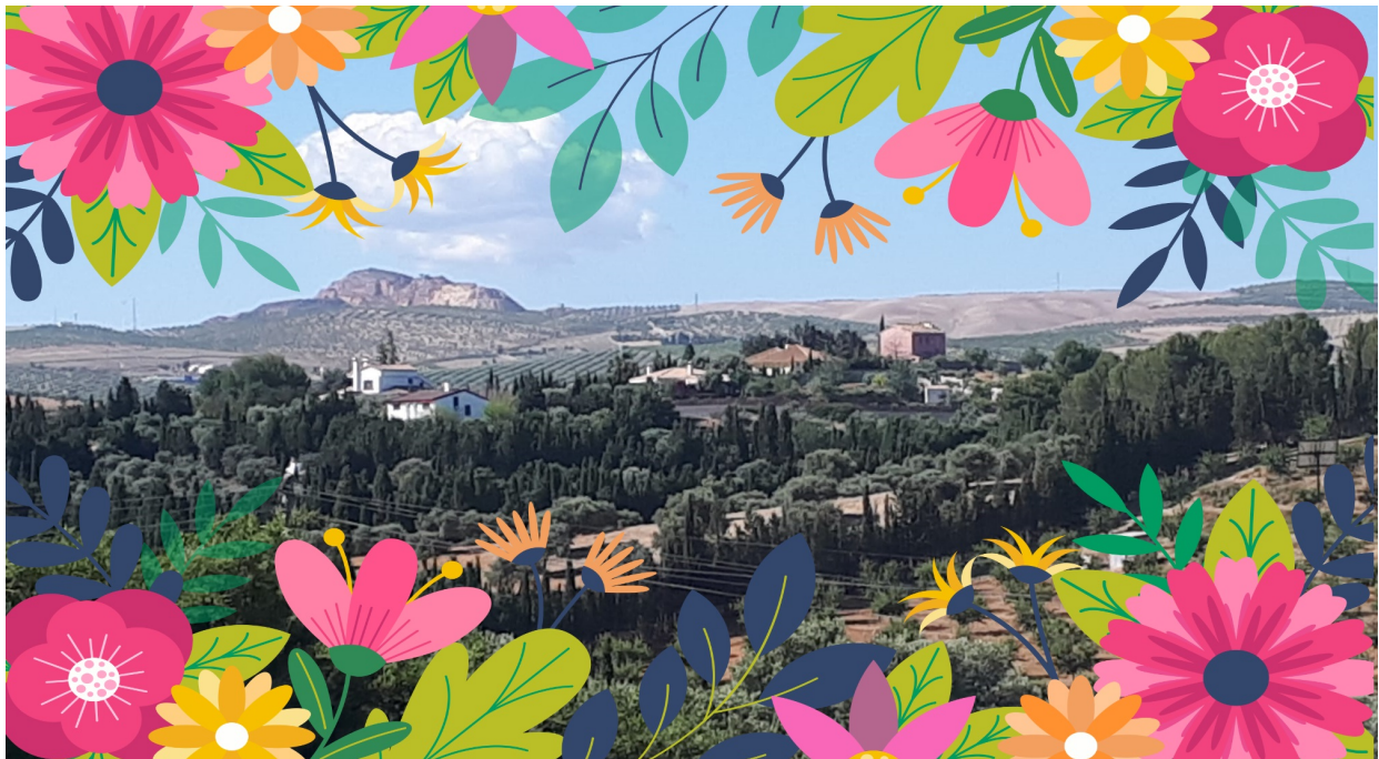
Vista del muulasterio con Montevives al fondo

Durante la semana del 28 al 31 de mayo se han llevado a cabo las convivencias de primavera de nuestro amado Muulasterio Tseyor La Libélula.