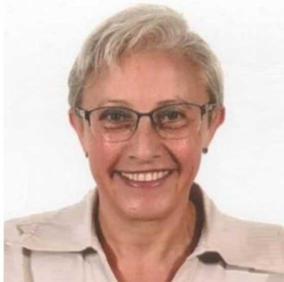
Piedra La Pm