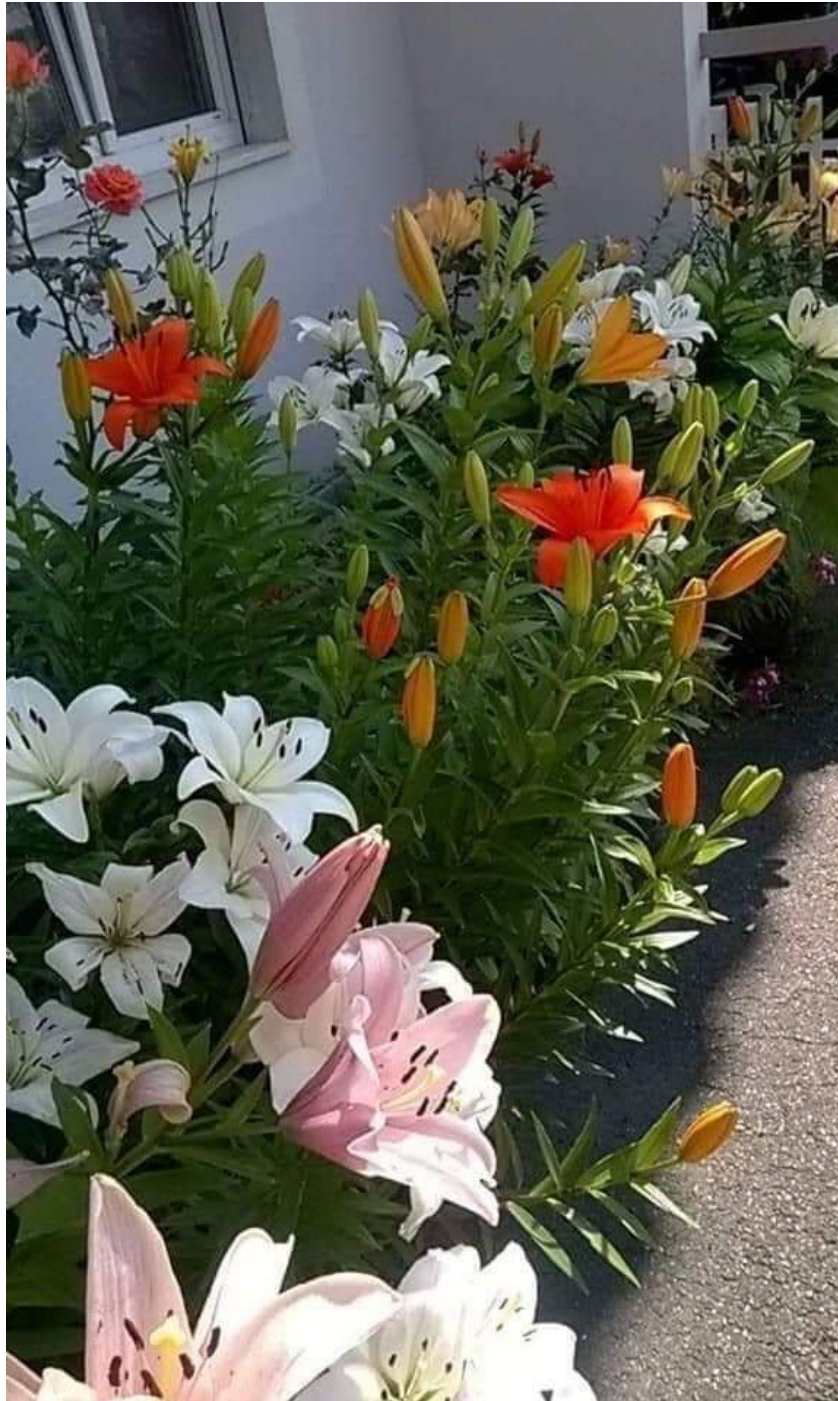
Foto del jardín de la hermana Un Simple Movimiento La Pm.