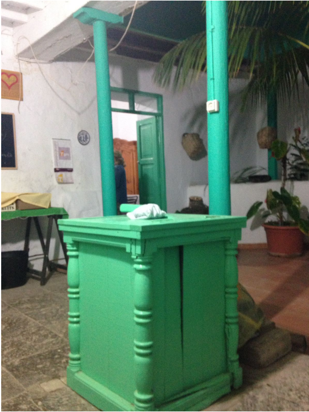
![undefined](/almacen/medios/entradas/31/WhatsApp Image 2017-04-26 at 13.56.46-Photoroom.webp)