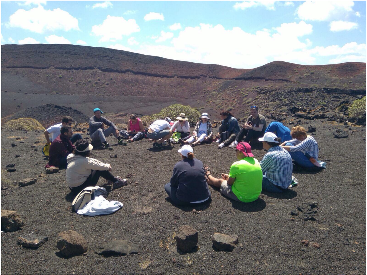
![undefined](/almacen/medios/entradas/31/WhatsApp Image 2017-04-26 at 19.10.49-Photoroom.webp)