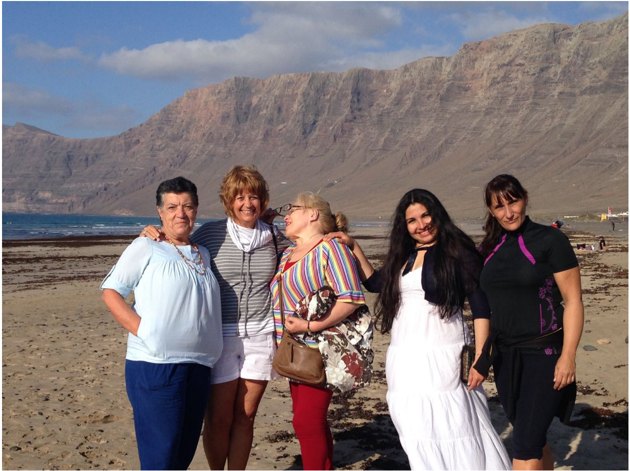
![undefined](/almacen/medios/entradas/31/WhatsApp Image 2017-04-26 at 13.55.27- Photoroom.webp)