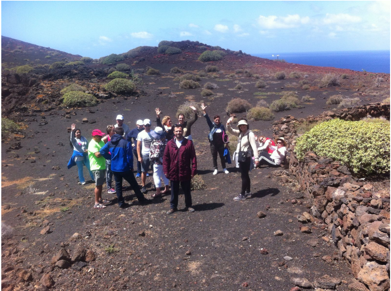
![undefined](/almacen/medios/entradas/31/WhatsApp Image 2017-04-26 at 19.15.35-Photoroom.webp)