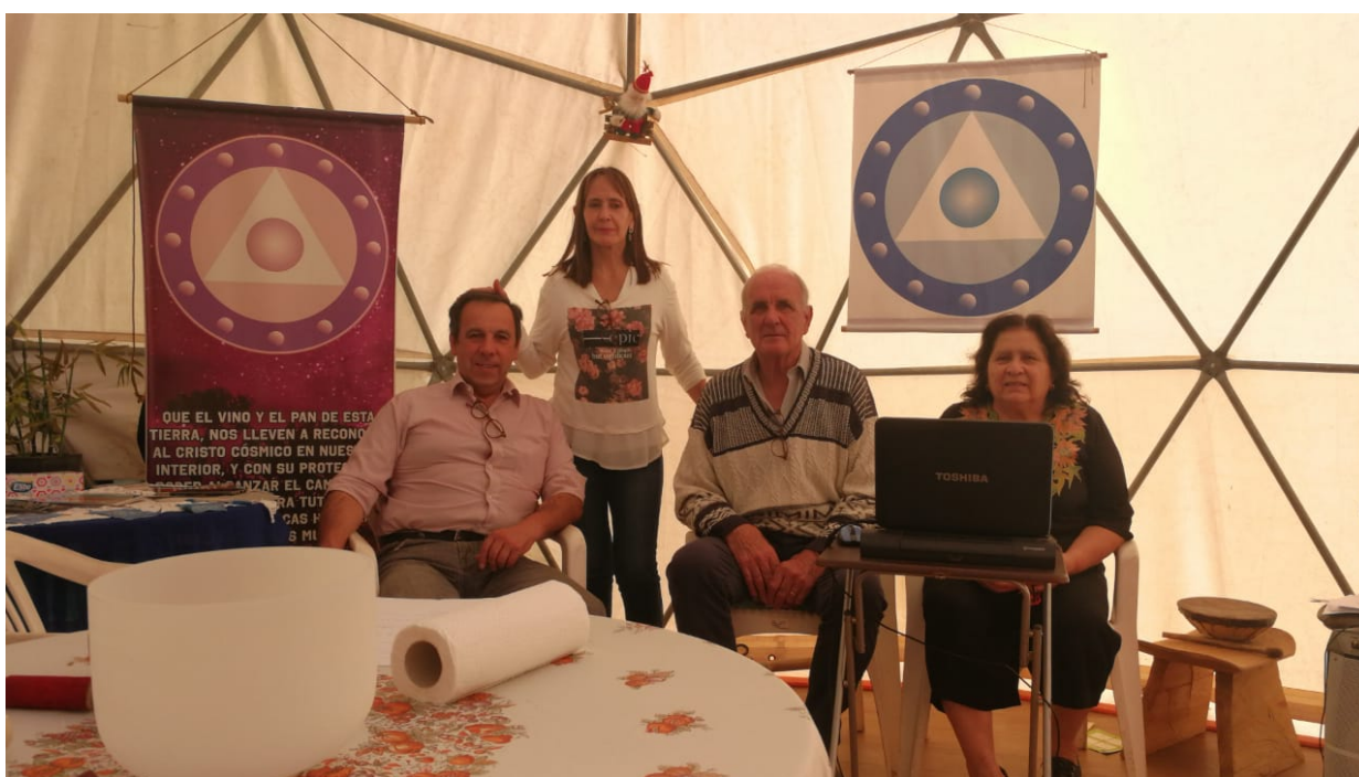
De pie, Guardando Fuerzas La Pm

Respecto a los sueños podemos rectificar situaciones de esta 3D si estamos atentos a la repetición de los mismos.