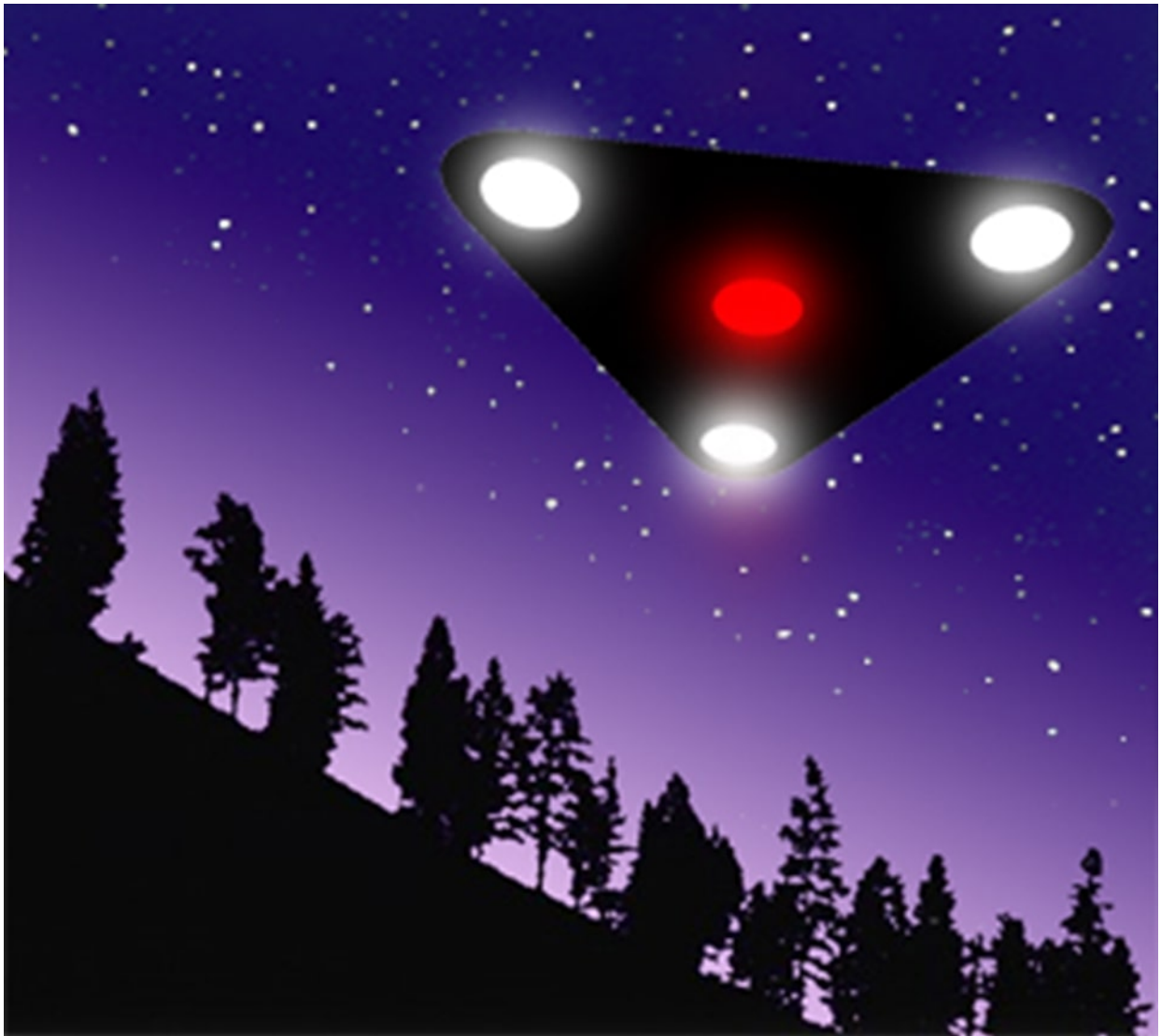
Ufología. Concepto artístico de un típico objeto triangulo negro.