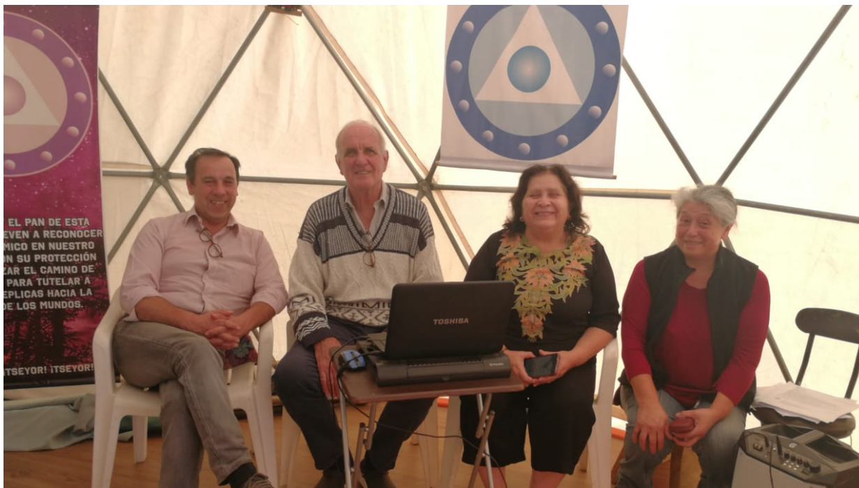
Donde Quieras La Pm, Vencer Primero La Pm, Un Trato Amable La Pm, No Creas en Logaritmos La Pm, conectados desde la IX Región