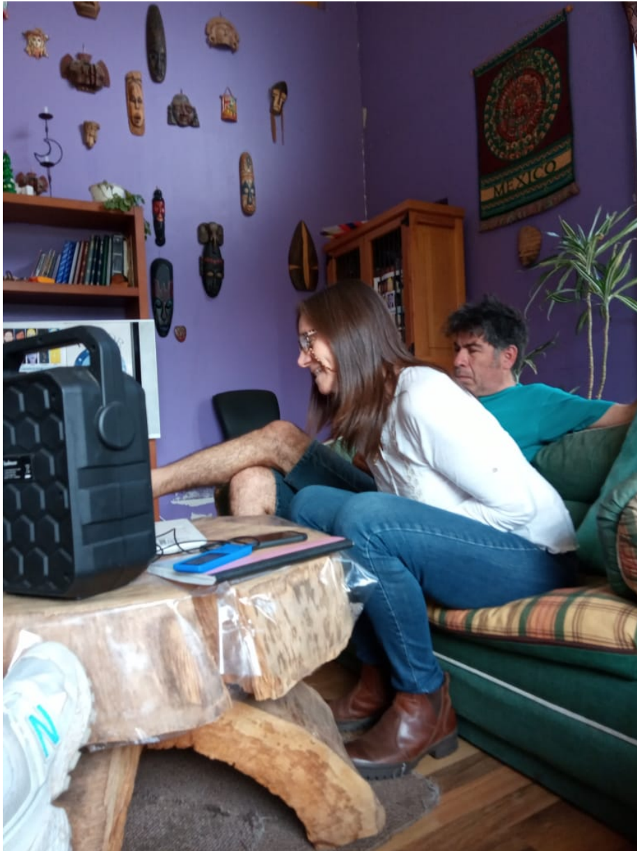
Conectando con la sala virtual de Paltalk

Se comenzó con una breve introducción al tema de los sueños, en donde nuestra hermana Colorea Copiosamente La Pm nos compartió una síntesis a modo de introducción a este tema tan interesante como son los sueños, tan poco trabajado hasta ahora dentro del colectivo. Posteriormente le siguieron una serie de aportes a modo de retroalimentación del colectivo de Chile, distribuido en tres puntos de la geografía Chilena.