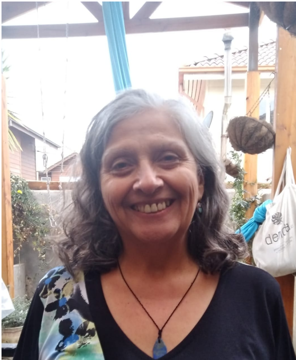
Predica Corazón Pm