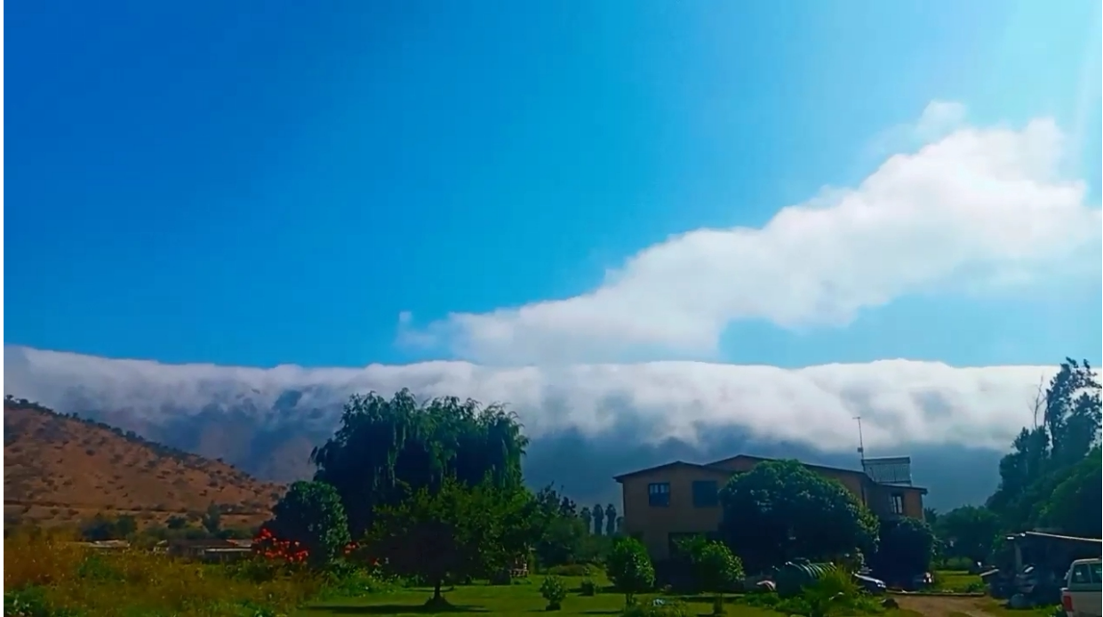
Muulasterio Tseyor Los Castaños

El día 17 de abril del presente año 2021 se llevó acabo la energetización de nuestra hermana Colorea Copiosamente La Pm.