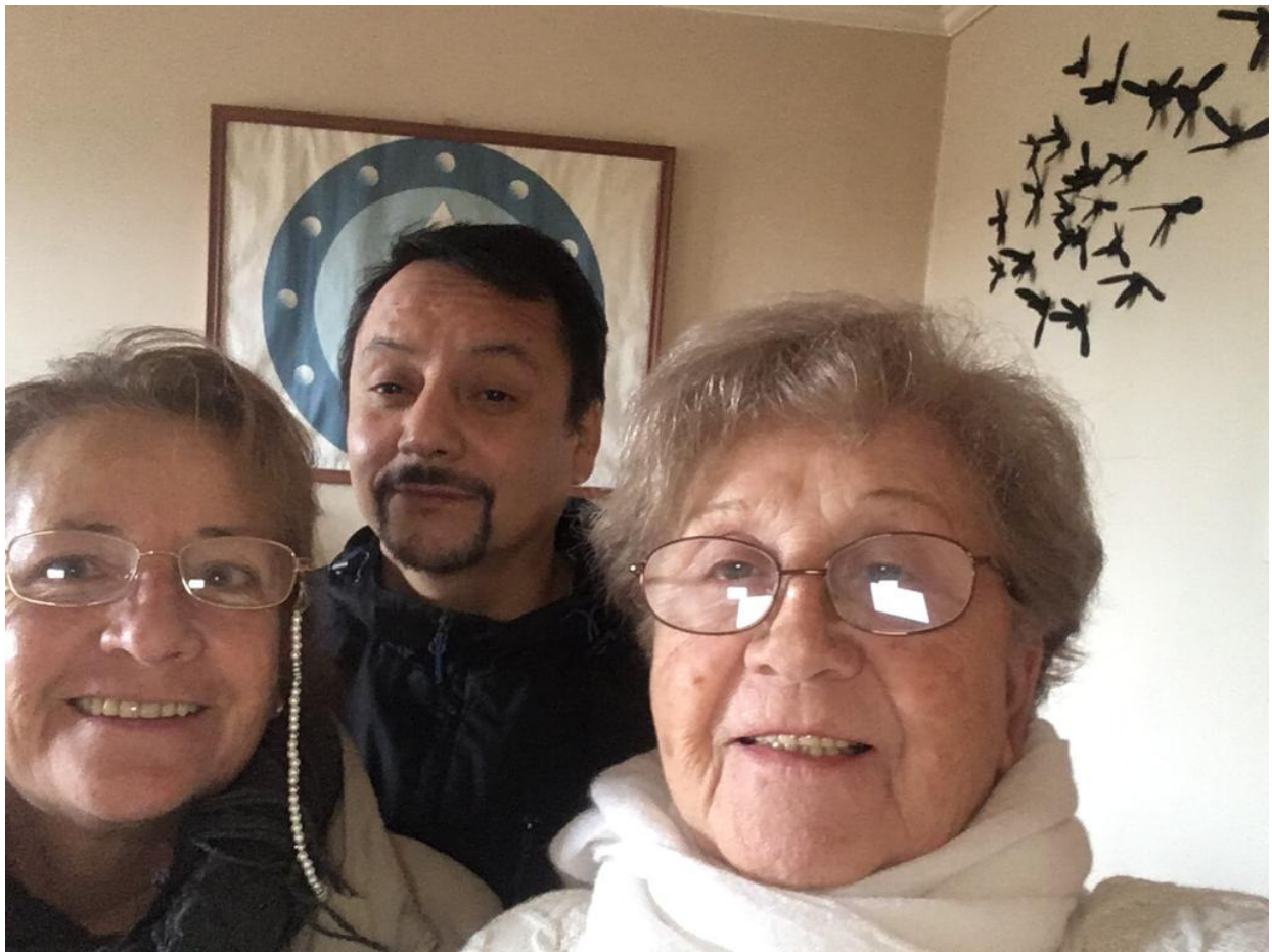
Un Futuro Encuentro La Pm, Lo Vas a Resolver La Pm y SoldeVila Pm