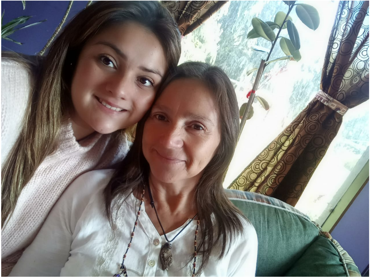
No a la Tun Tun La Pm, Colorea Copiosamente La Pm

Las hermanitas Predica Corazón Pm y Fruto del Castaño Pm nos acompañaron vía paltalk aportándonos su amoroso trabajo desde su hogar.