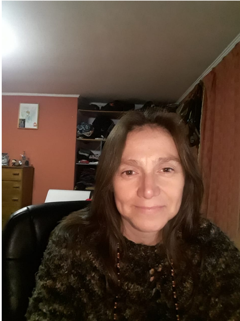
Colorea Copiosamente La Pm

El haber sido reconocida por la Confederación de Mundos Habitados de la Galaxia como Piora del Muulasterio Tseyor Los Castaños ha sido hermoso, especial, nunca imaginé que iba a sentir todo lo que sentí, sobre todo en la canalización de la energía de Aium Om.