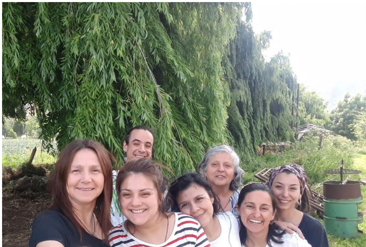
En frente: Col Copiosa Pm, Tun Pm, Referencia Tseyor La Pm, Fruto del Castaño, En Progreso La Pm. Detrás: Suma Perfección La Pm, Predica Corazón Pm