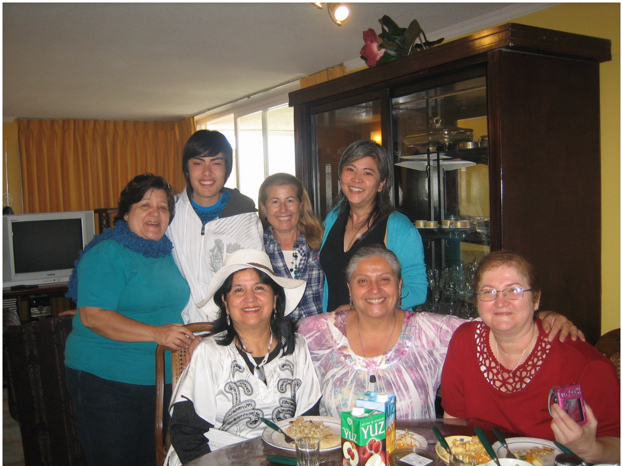
Reunidos en viña del mar, en casa de Pin Tseyor