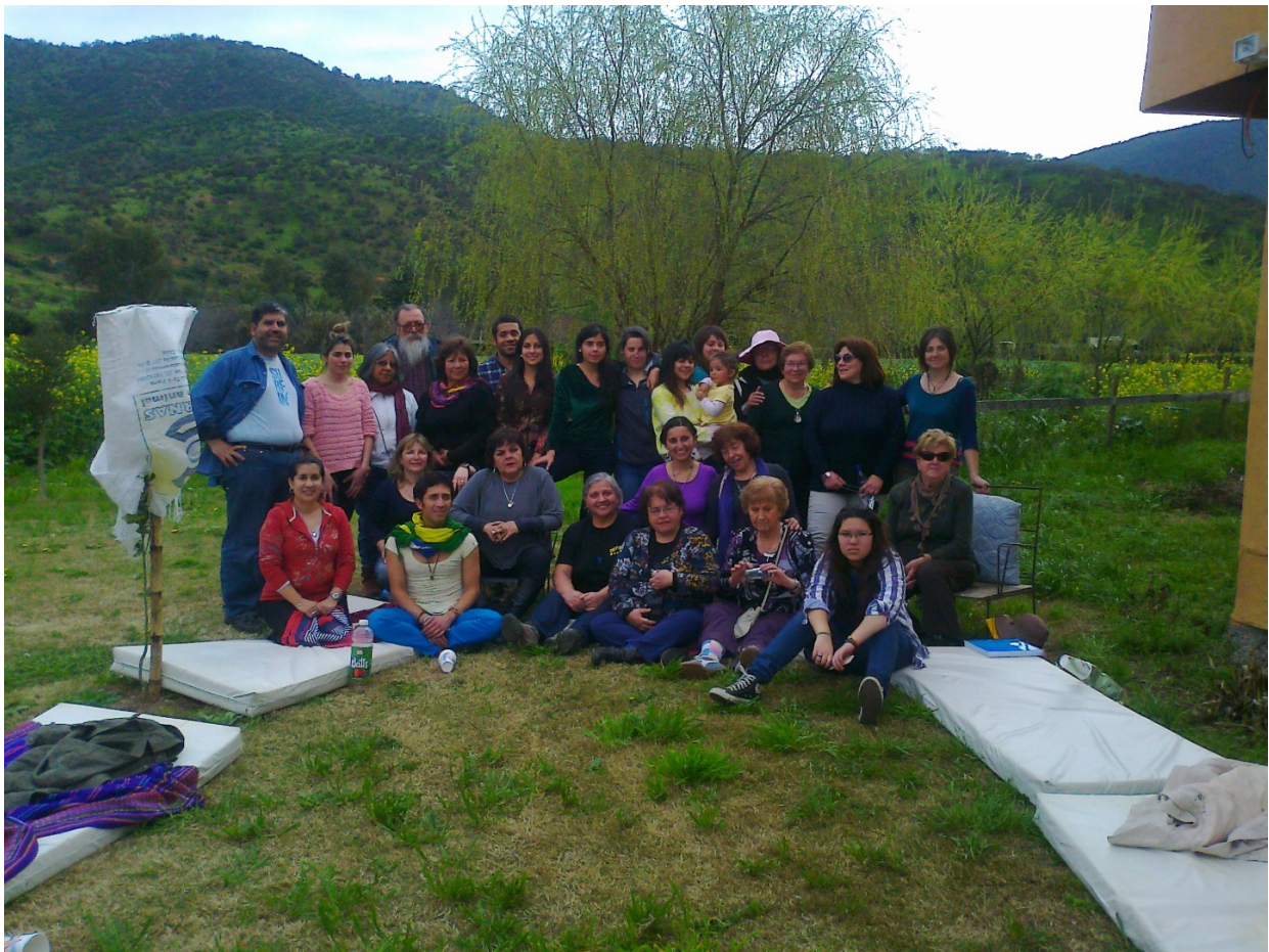
Todos los hermanos reunidos en el patio

Este fue el momento en que se energetizó por primera vez el lugar, en este caso, la casa de Col Copiosa Pm y Verde Pm. Cuando aún no existía siquiera el concepto de "Casa Tseyor" tal y como hoy en día lo conocemos, ya se instauró en el lugar una energía que prepararía el contexto necesario para un futuro proceso que aún no podíamos vislumbrar.