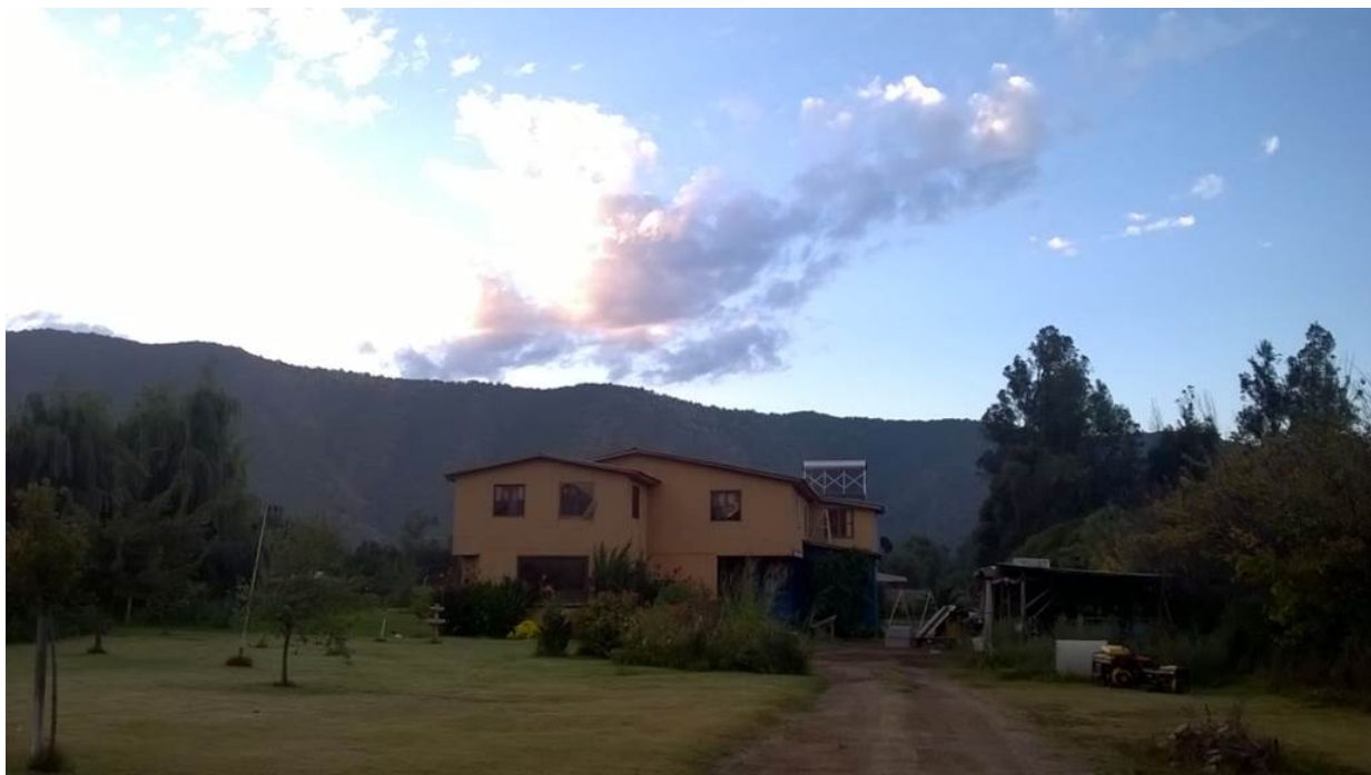
Casa Tseyor Los Castaños, que pasa a ser un anexo del Muulasterio Tseyor Los Castaños

La apertura de un nuevo Muulasterio en Chile siempre es un motivo de alegría, un impulso para el proyecto Tseyor, y en este caso ha sido un evento largamente anhelado por el colectivo.