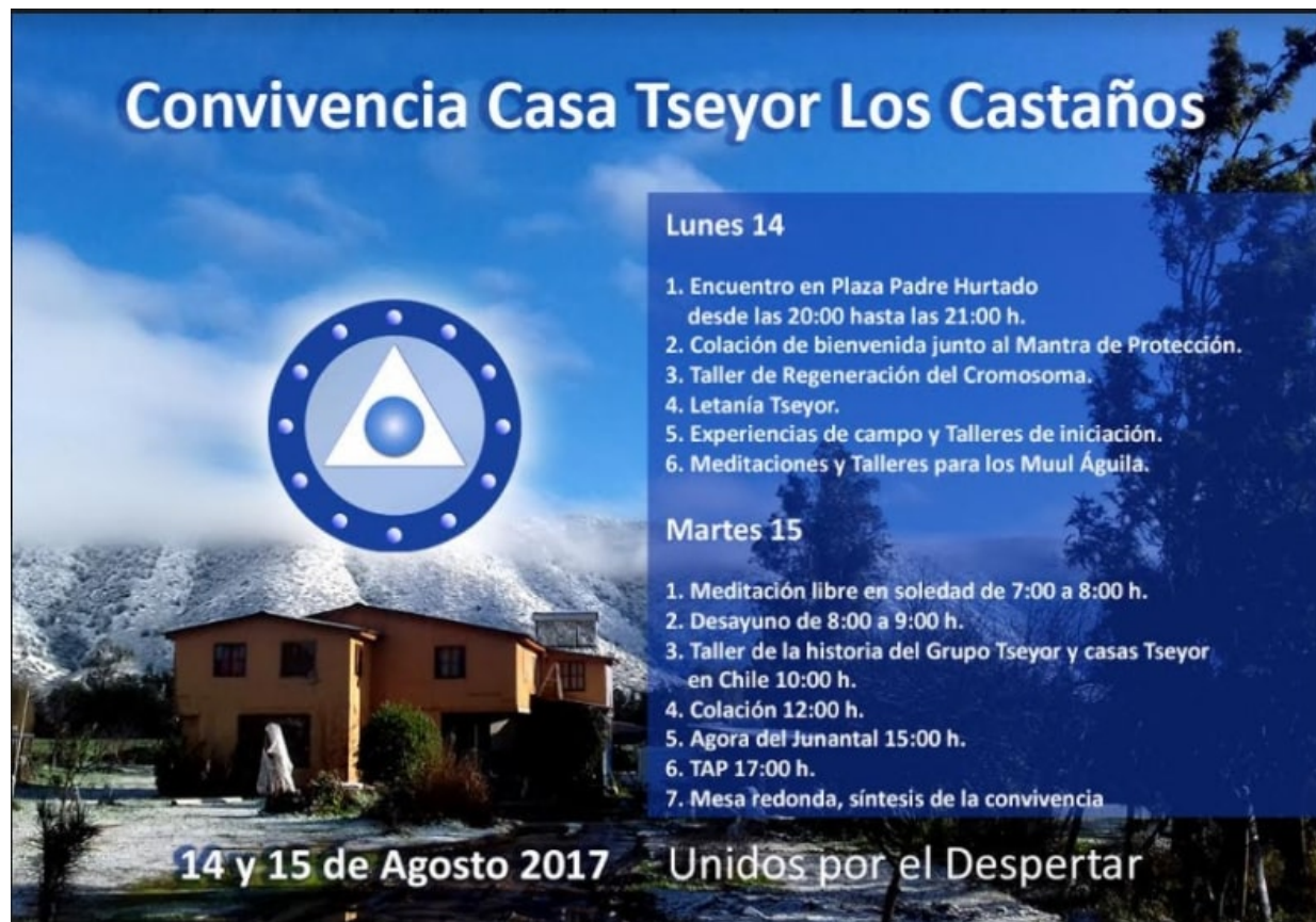
Cartel del evento