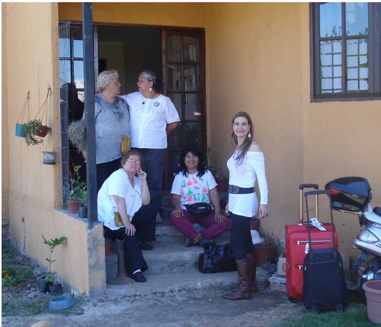
Autora, Predica Corazón Pm, Acuífero Azul Pm, Sublime Decisión La Pm, Blanco y Negro La Pm (antes Polipintura Pm)