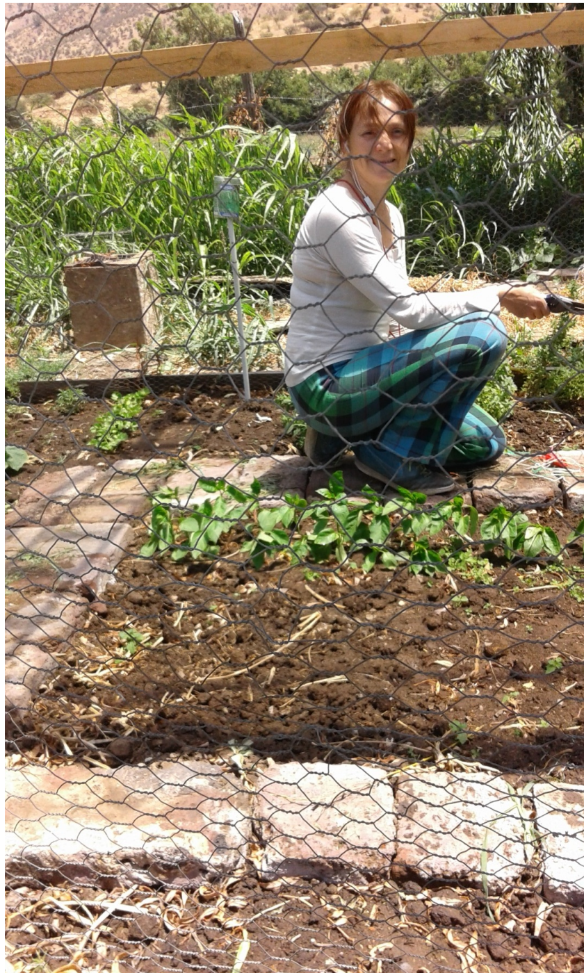
Col Copiosa Pm (actualmente Colorea Copiosamente La Pm) en la huerta