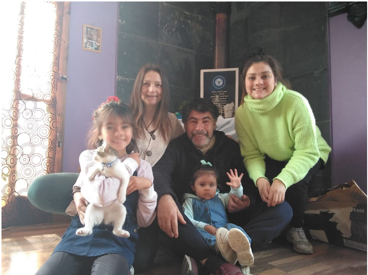
Familia de la Casa Tseyor, con Colorea Copiosamente La Pm (anteriormente Col Copiosa Pm), Verde Pm, No a la Tun Tun Pm (anteriormente Tun Pm), y las niñas Generadora de Luz La Pm, Xamana Elena Gabriela