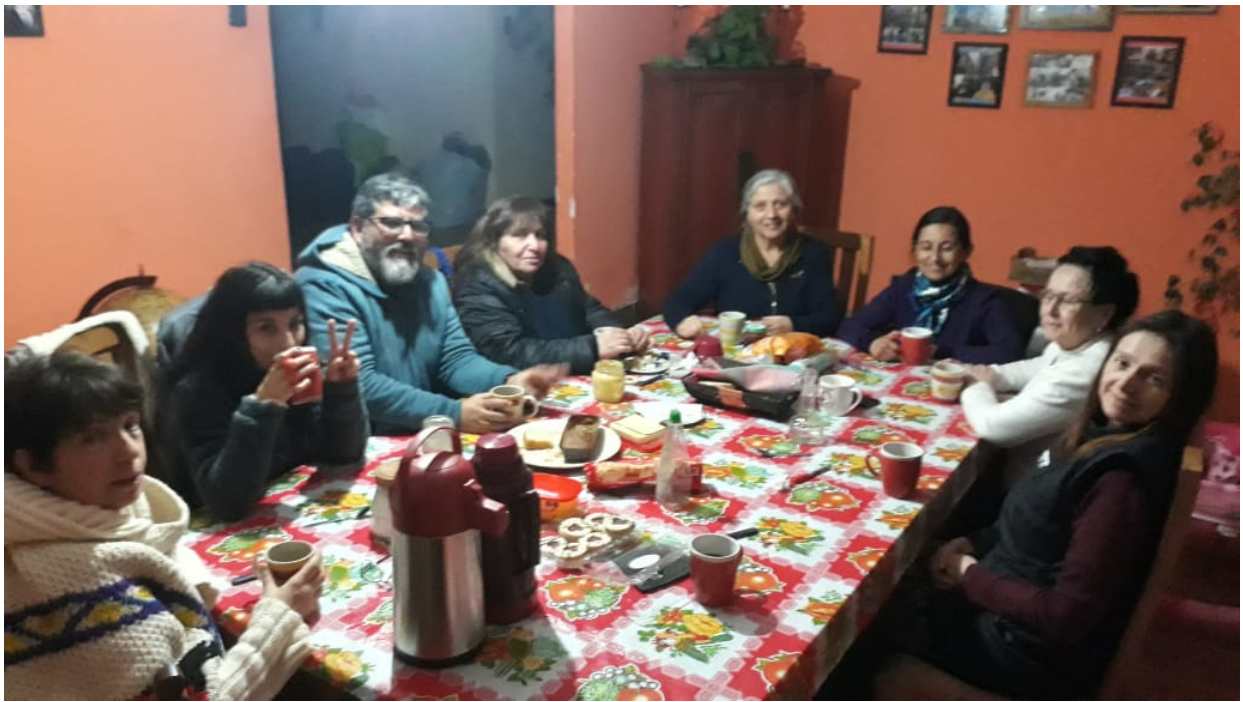
Retiro en la Casa Tseyor Los Castaños