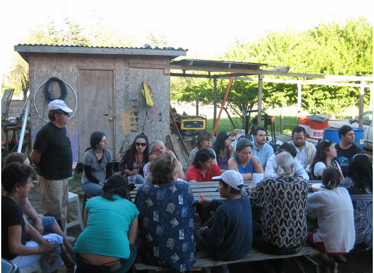
Reunidos y retroalimentando con el taller de los símbolos