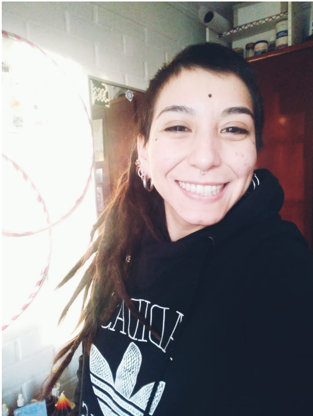
Avanza Progresivamente La Pm (anteriormente En Progreso La Pm)

A partir de ahora el proyecto continuará hacia la construcción del edificio físico donde se ubicará el alojamiento necesario del Muulasterio Tseyor propiamente, para todos aquellos hombres y mujeres que necesiten ese momento de silencio, de retiro en recogimiento interior para el autodescubrimiento y poder así servir mejor a la energía. El lugar ya está energetizado, bendecido y auspiciado por la Confederación de Mundos Habitados de la Galaxia, disponemos del equipo humano y solo queda andar hacia adelante, sin desfallecer, todos a una. Pues el proyecto lo merece.