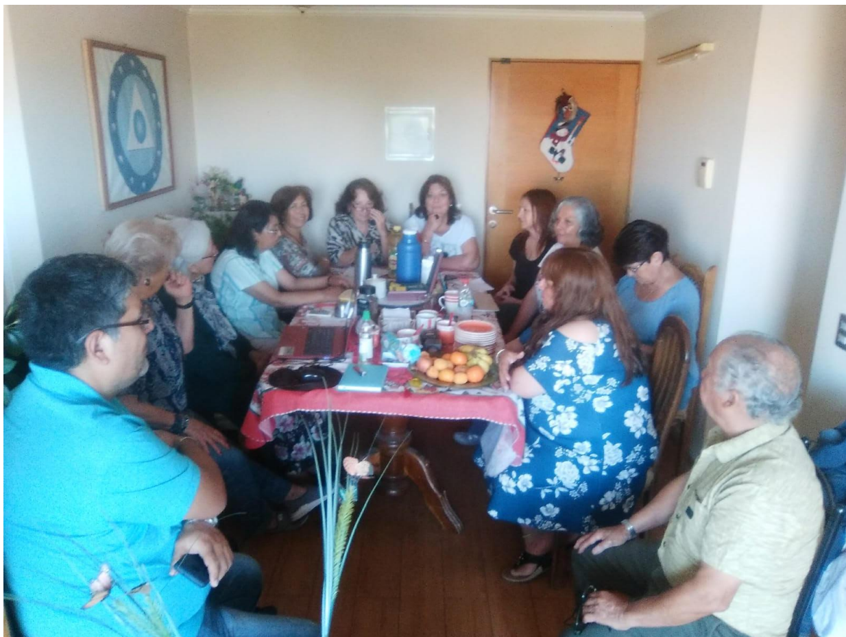
Reunidos en casa de Soldevila Pm