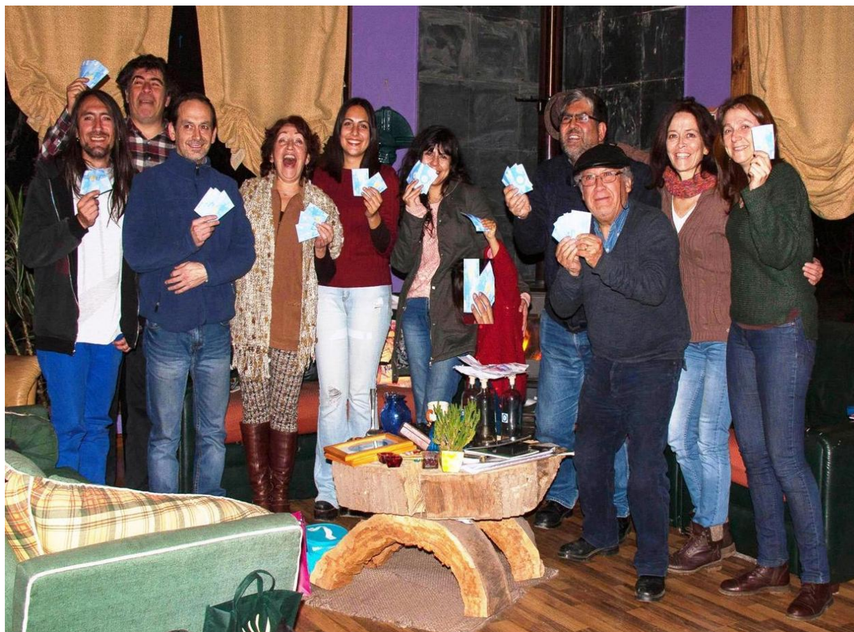
Juego con el muular