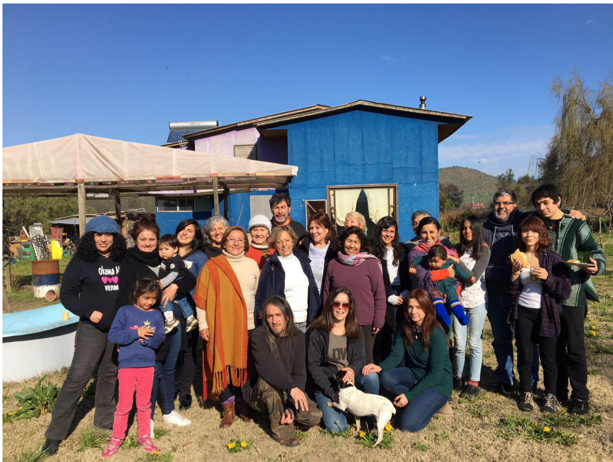
Todos los hermanos de la zona reunidos