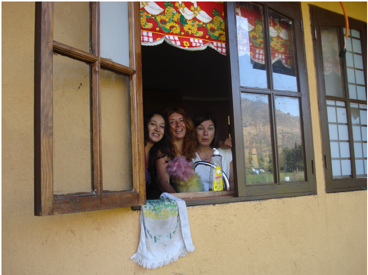
Cimarrón Futuro Pm, Capitel Pi Pm y Camello. En la cocina de la Casa Tseyor (ahora ya Muulasterio)