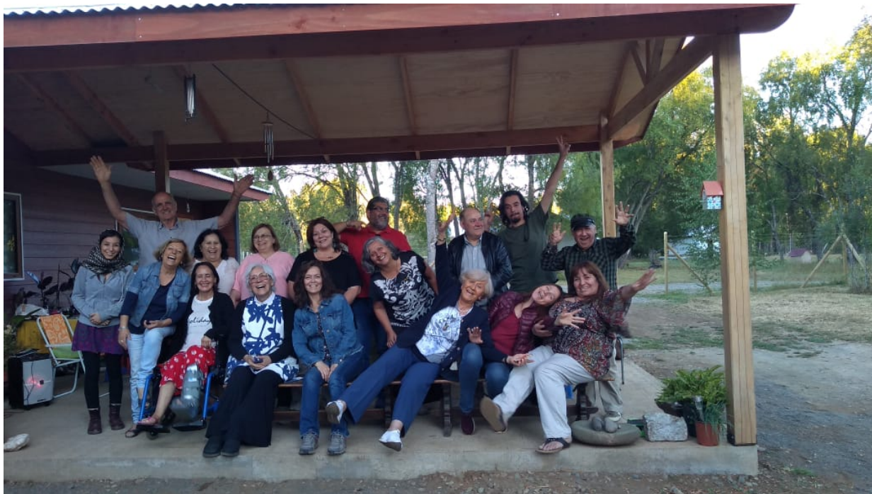
Los hermanos reunidos en el porche