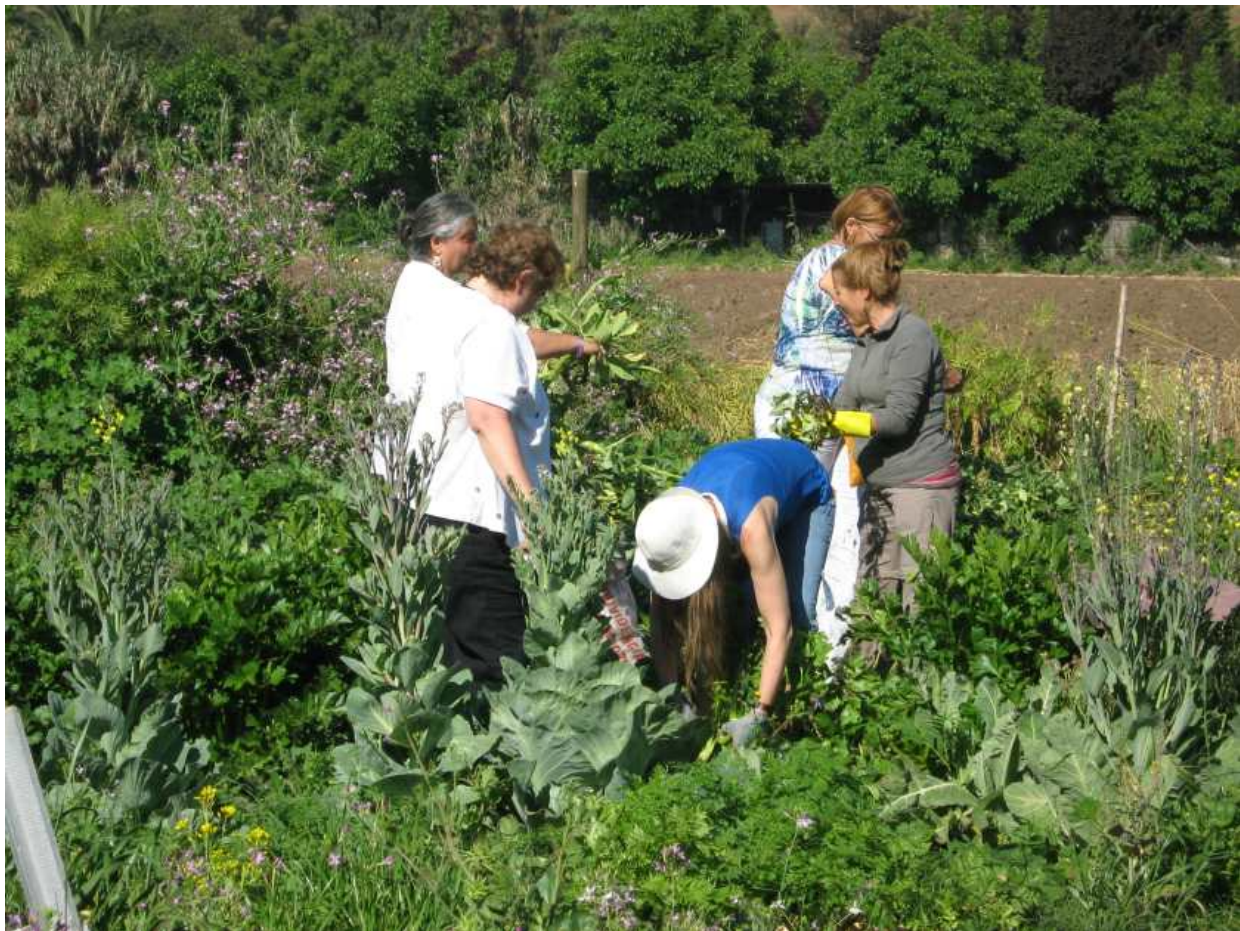
Un grupo de hermanas trabajando en la huerta