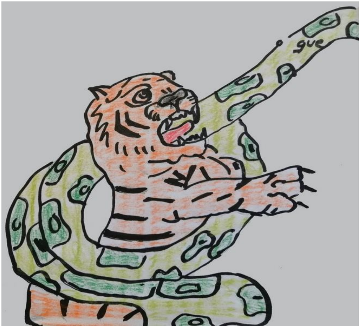
Fábula del Tigre y la Serpiente

Los hermanos de las estrellas siguen insistiendo en que habrá un momento, en un tiempo futuro próximo, que habremos de acudir al llamado. Un llamado que estamos esperando desde hace muchos años, al cual habremos de acudir, y eso significa calzarse las sandalias y ponerse en marcha. Nuestra casa será el mundo entero, y nuestra misión, la divulgación del mensaje Crístico-Cósmico, dando ejemplo de ello, a través de la ayuda humanitaria.