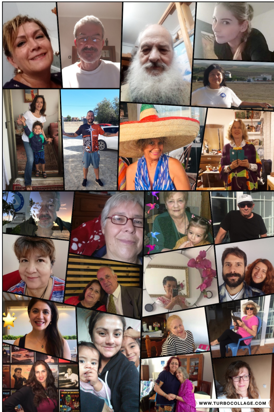
Algunos de los asistentes al retiro online, que en total fueron más de 136