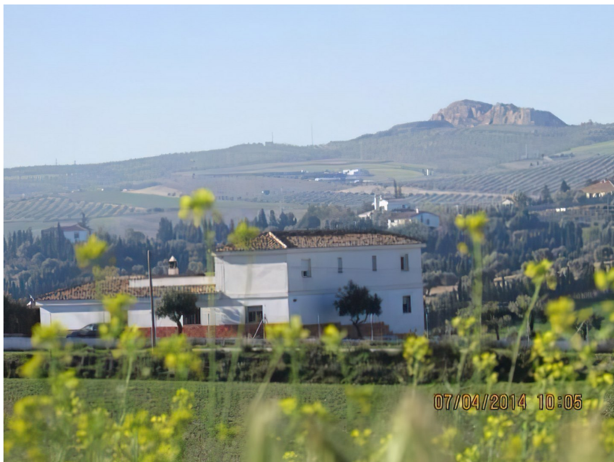
Vista exterior del Muulasterio La Libélula. La montaña de Montevives al fondo a la derecha.

El Muulasterio está rodeado de un entorno natural en las afueras de Granada, en un pequeño pueblo llamado Cúllar Vega. Esto permite que el recogimiento sea mucho más fácil y efectivo de conseguir.