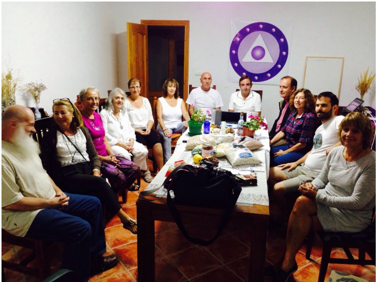
De izquierda a derecha: Claro Apesúrate La pm, Escampada Libre La pm, Mahón pm, Canal Radial pm, Especial de Luz La pm, Sala, Apuesto que Sí La pm, Puente, Castaño, Liceo, Pigmalión, Dadora de Paz pm.