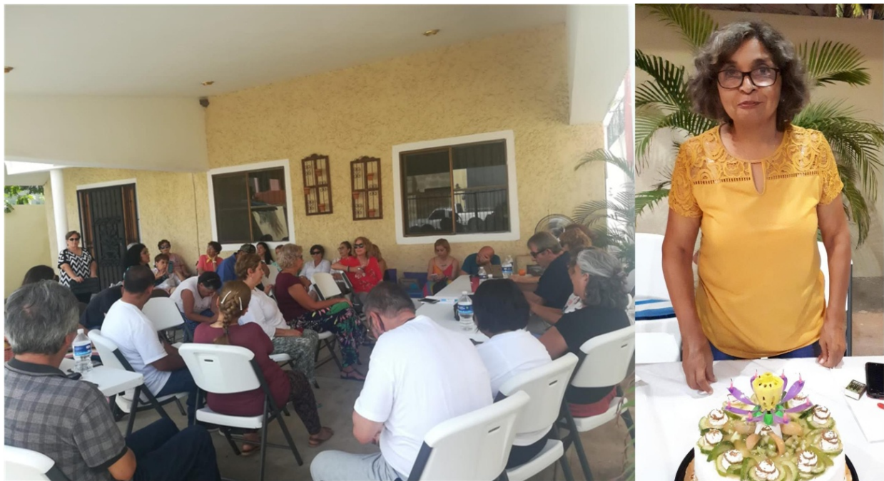
El grupo en una sesión de trabajo y a la derecha Síntesis La Pm, priora

Hoy hemos estado realizando el rescate adimensional de la visita a la Isla Venados. Después hemos estado leyendo y comentando el comunicado 1006 y Shilcars nos ha dado el siguiente comunicado.