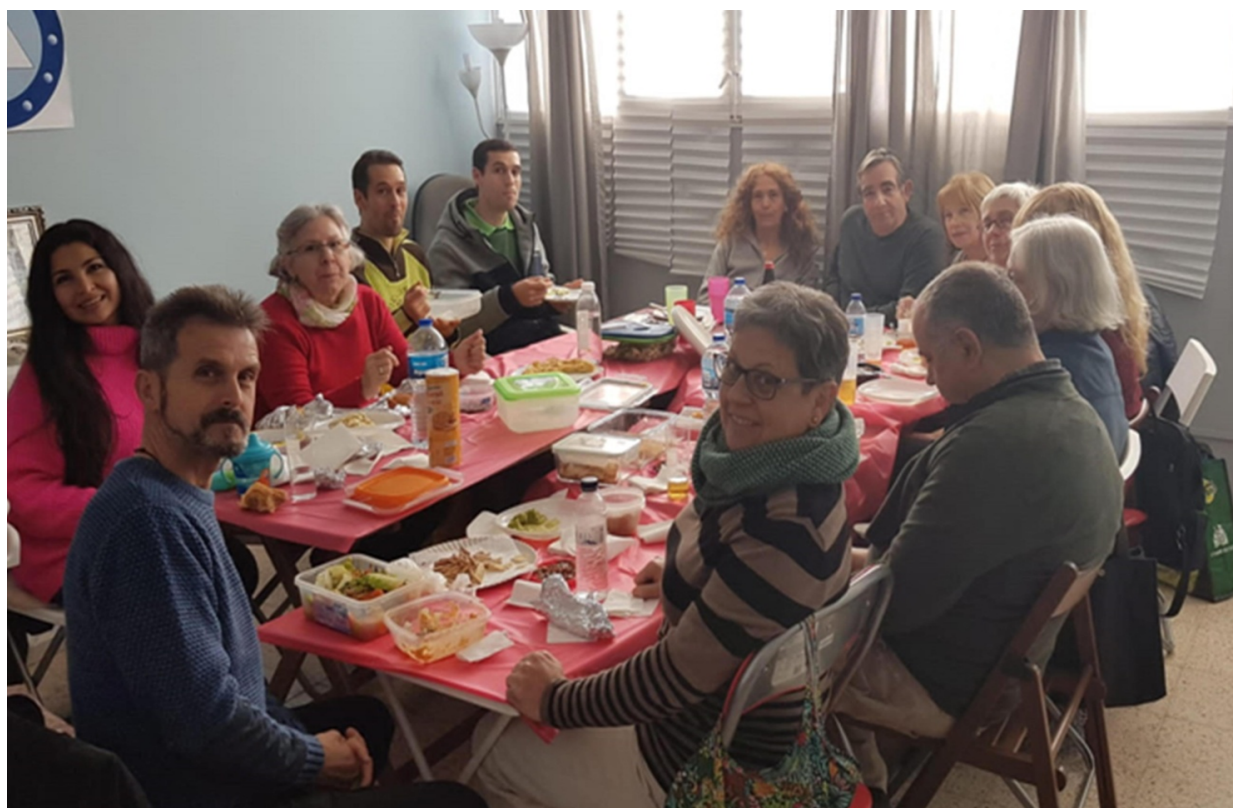
Asistentes a la comida de Navidad de la Casa Tseyor de Barcelona