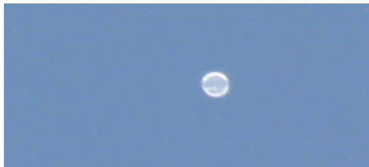
Foto de la nave en la noche del jueves 23 de enero en el Muulasterio Tseyor Tegoyo