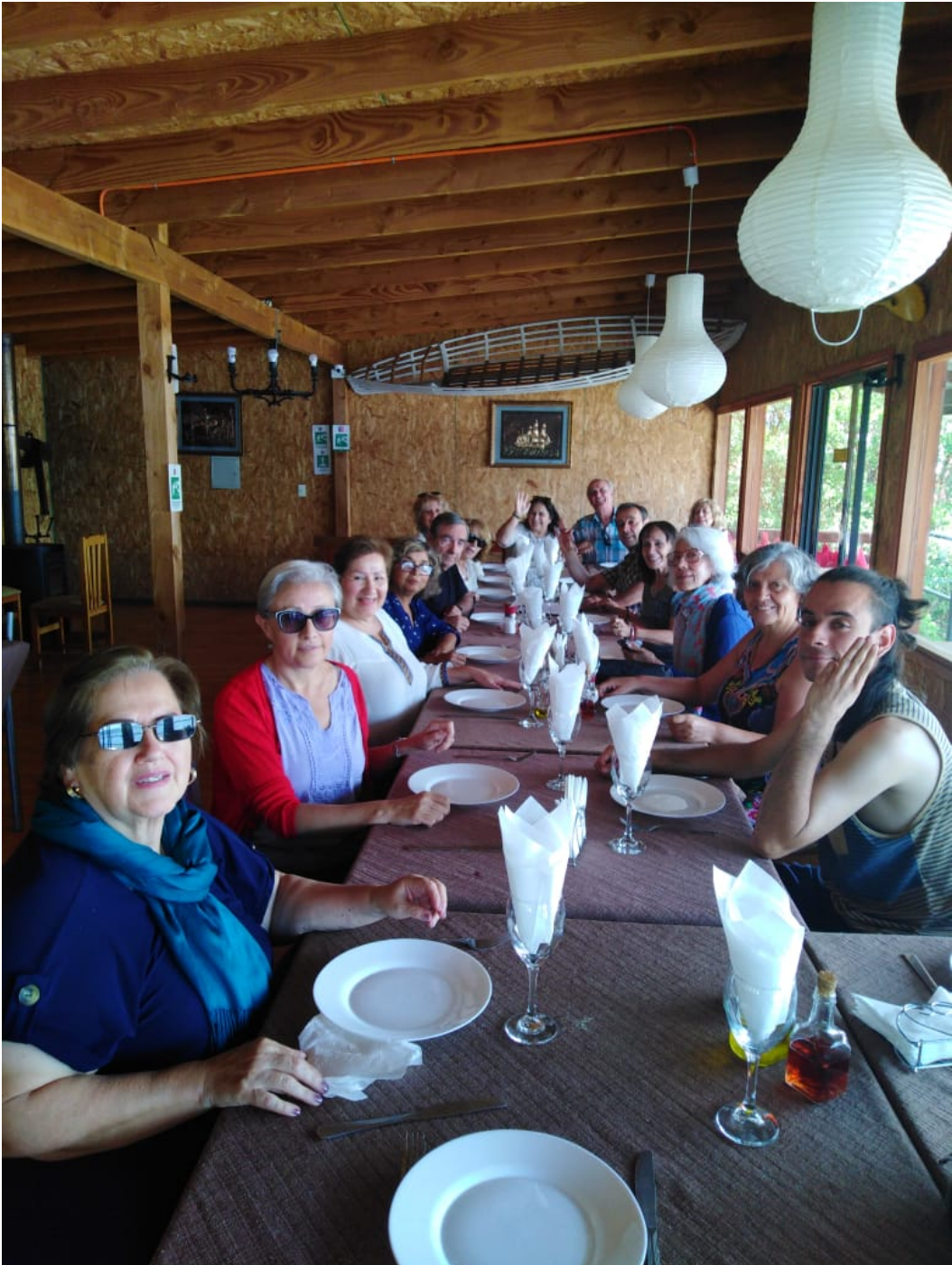
Almuerzo en Valdivia, capital de la Región de los Ríos