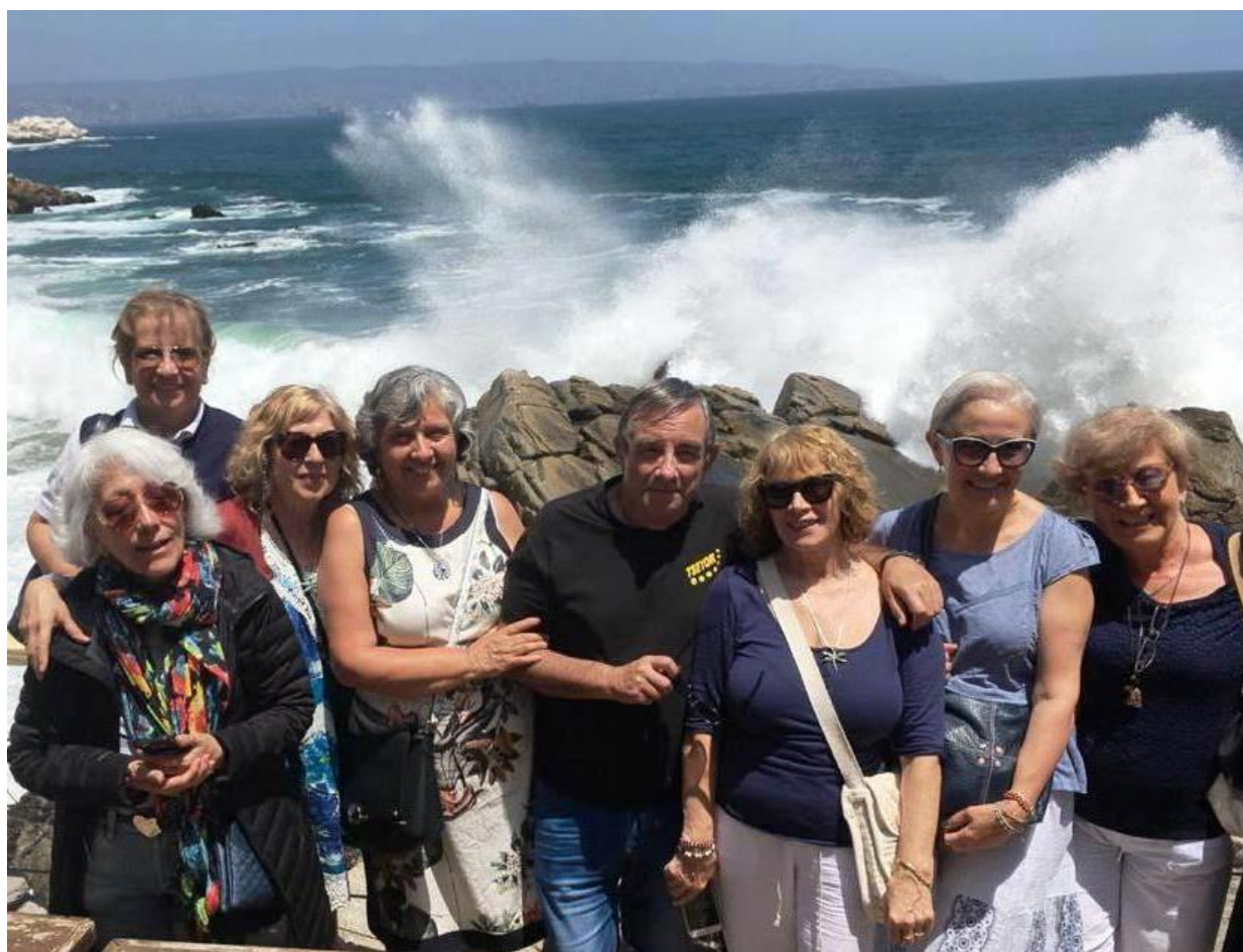
Viña del Mar-Chile. Izquierda en primer término, Misa Religando La Pm, detrás, Un futuro Encuentro La Pm, Liceo, Predica Corazón Pm, Puente, Sala, Mahón Pm, Sol de Vila Pm