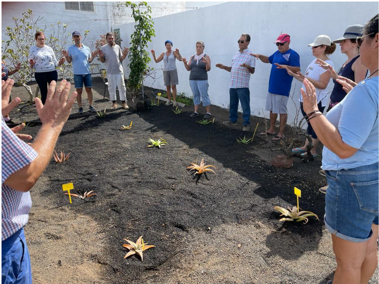
Trabajo en el huerto hoy