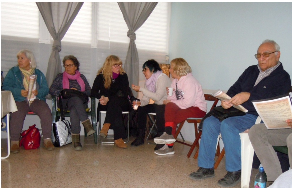
De izquierda a derecha: Electrón Pm, Un Buen Momento La Pm, Aquí Lo Tienes La Pm, Con Prontitud La Pm, No Te Vayas La Pm, Ya Eres Libre La Pm