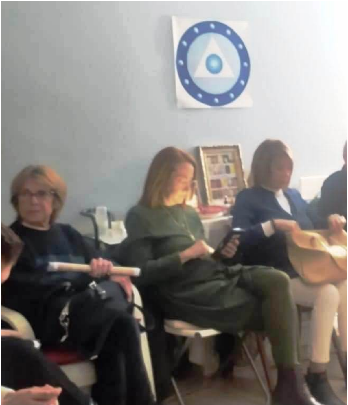
De izquierda a derecha: Con Buen Sabor la Pm, Empieza La Unión La Pm, Sala.