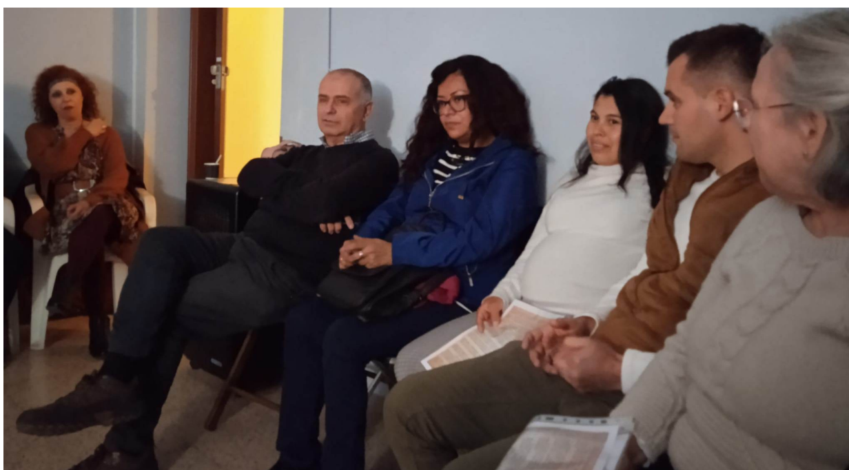
De izquierda a derecha: Un Poco de Paciencia La Pm, Patrón Marino La Pm, Orden en las Ideas La Pm, Escorpión Blanco La Pm, Una Pica en Barcelona La Pm, Manantial Inagotable La Pm.