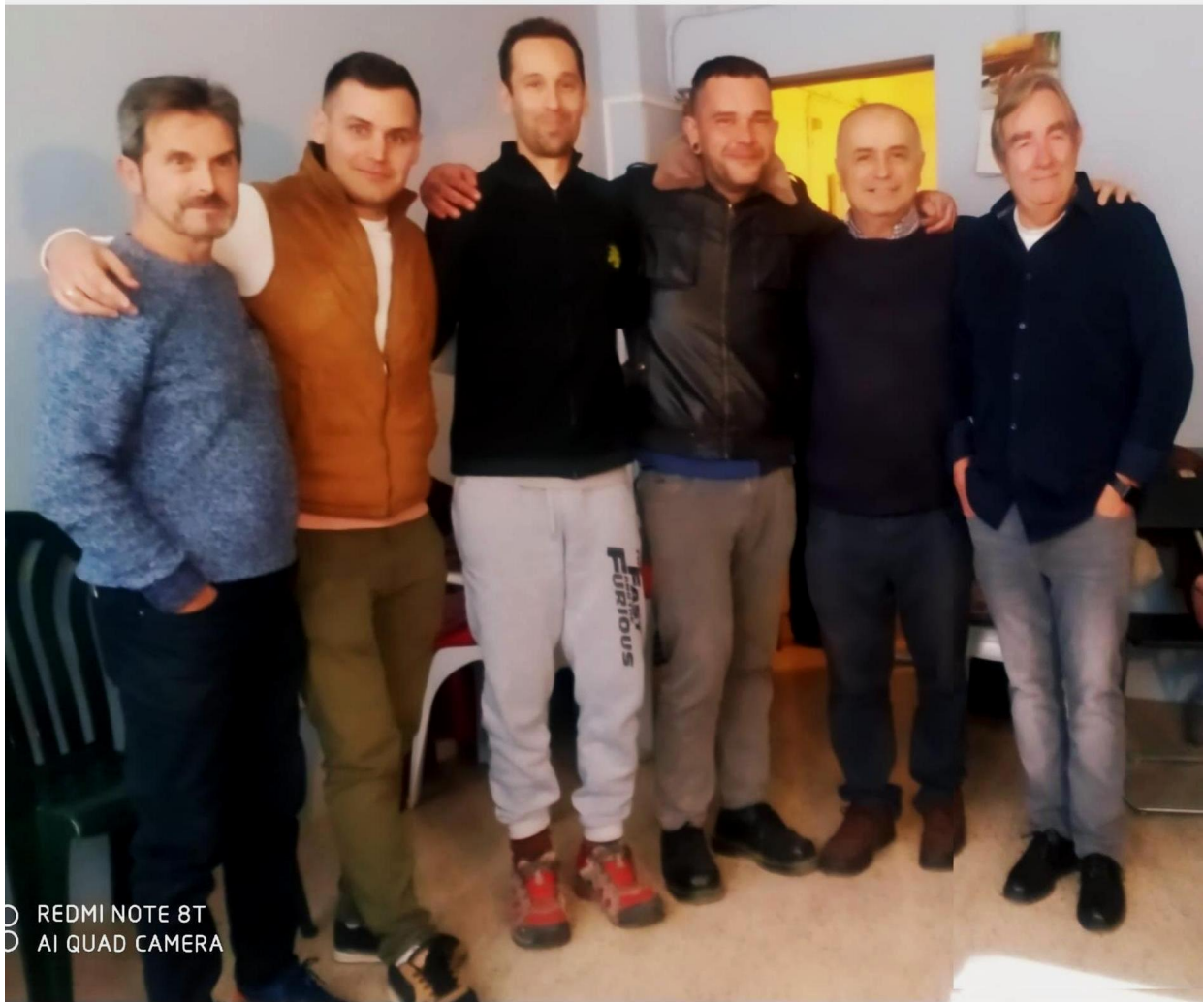
De izquierda a derecha: Oro en Polvo La Pm, Una Pica en Barcelona La Pm, Jabón Espumoso Pm, Nunca Renuncies La Pm, Patrón Marino La Pm, Puente.