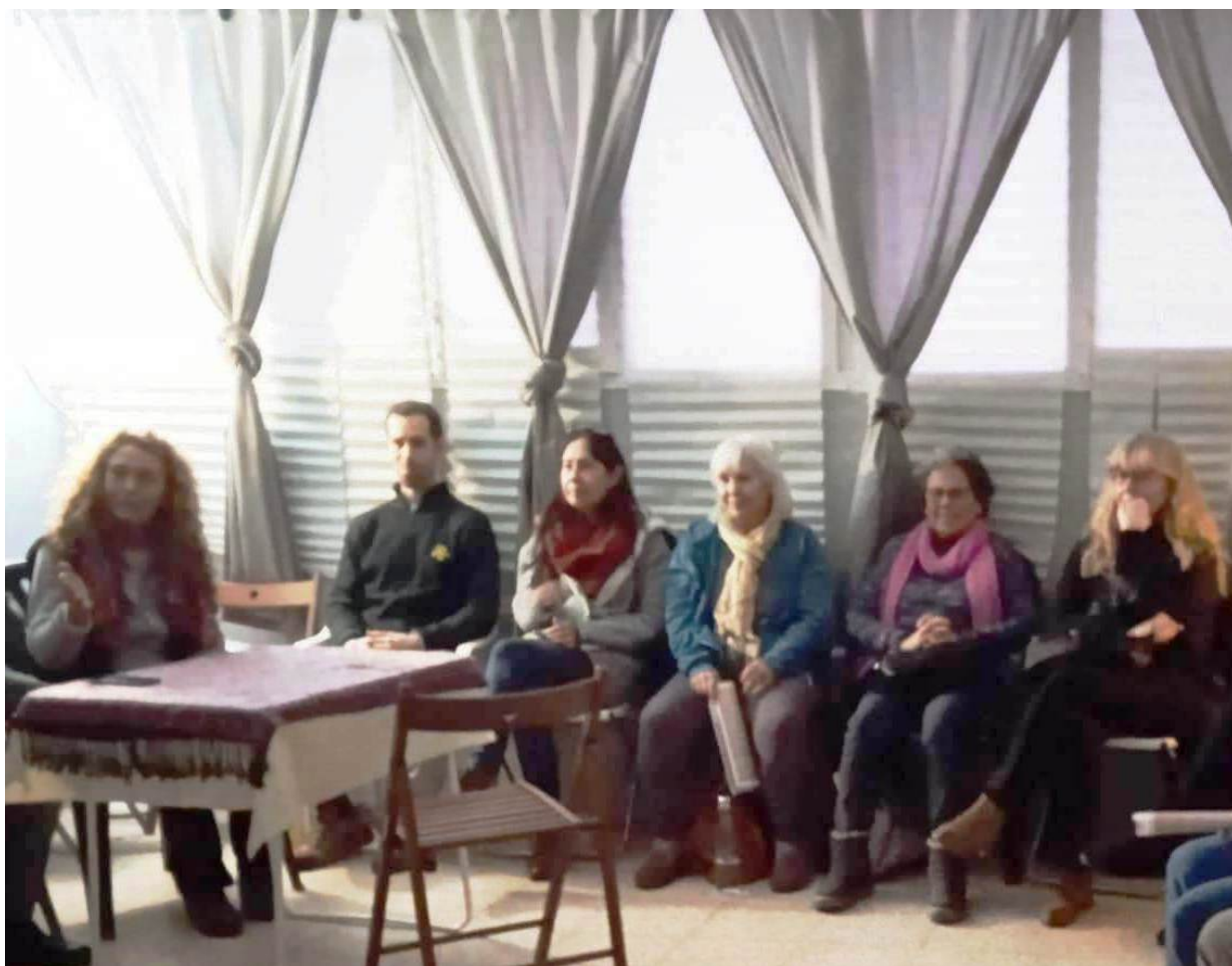
De izquierda a derecha: Magda La Pm, Jabón Espumoso Pm, Con Instrucción La Pm, Electrón Pm, Un buen Momento La Pm, Aquí Lo Tienes La Pm,