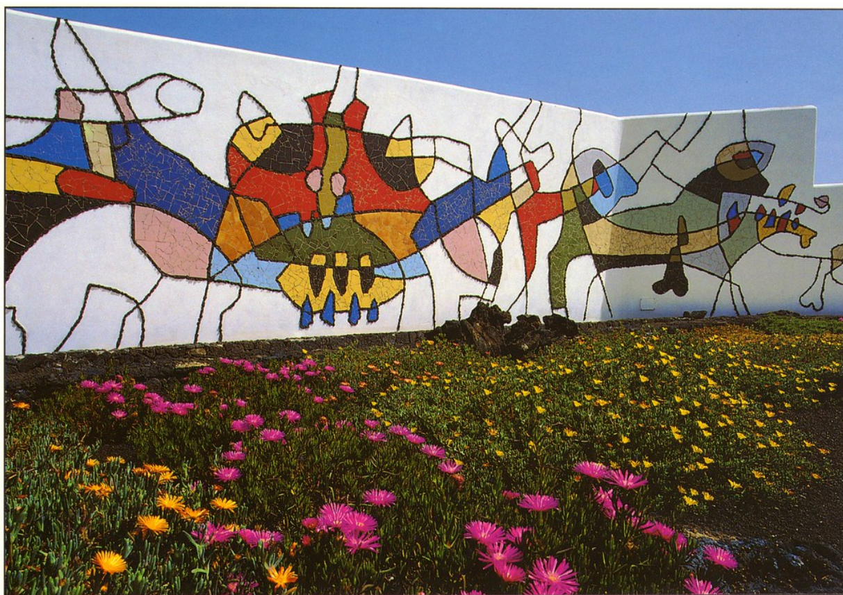
Mural de César Manrique en la Fundación que lleva su nombre (Lanzarote)