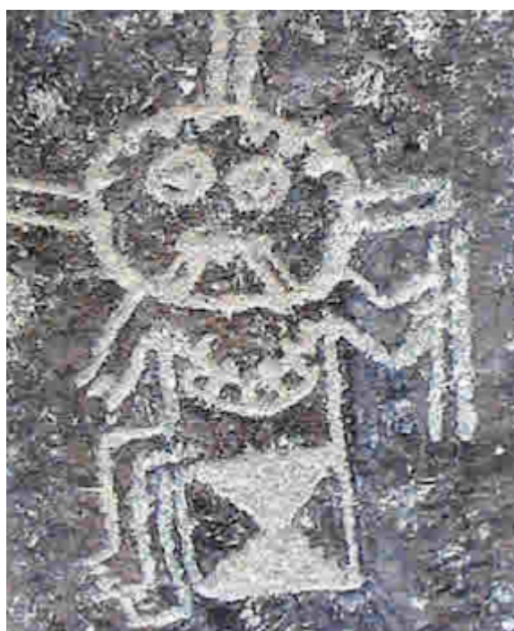
Tridáctilos: Petroglifo en Chichictara Cultura Paracas (Topará) – Palpa – Ica – Perú