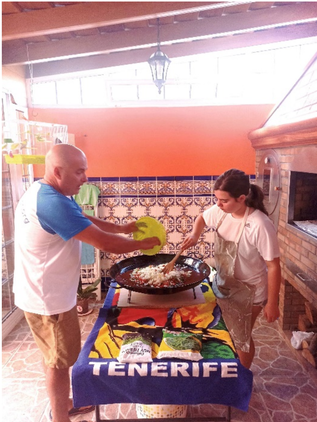
En tu propia búsqueda La Pm y Mirando al mar La Pm