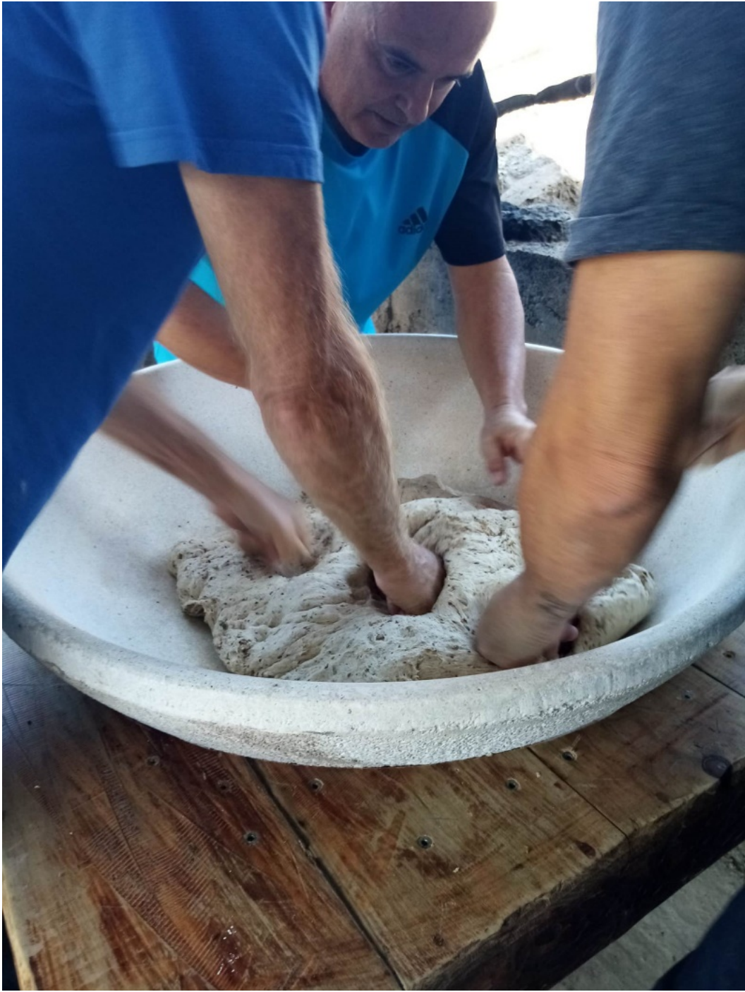
Amasando Pan Tseyoriano