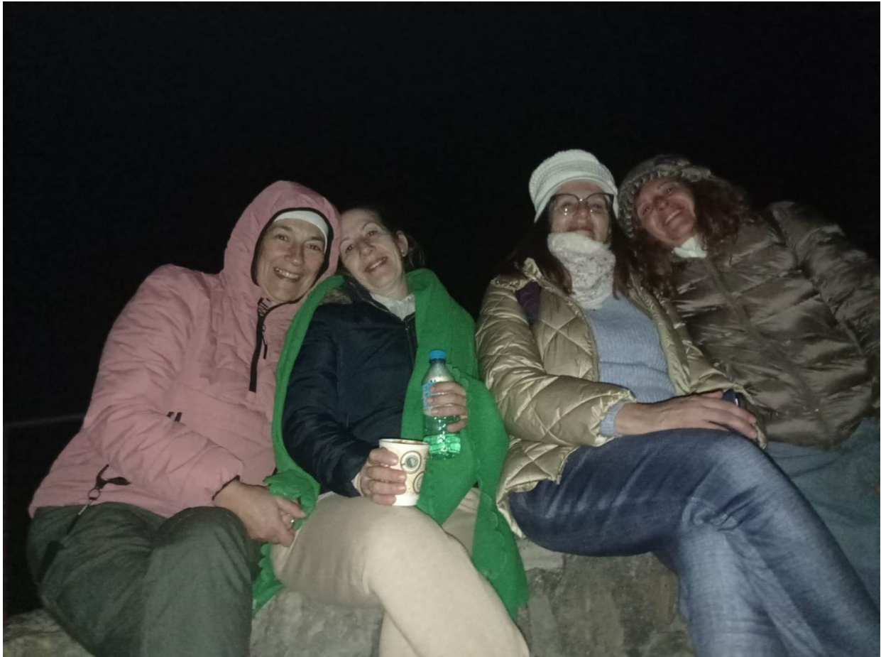
Bajo las estrellas