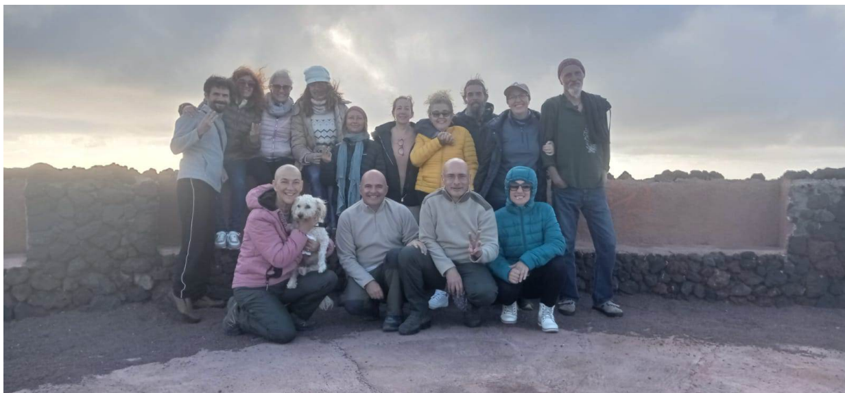
Volcán de Fasia