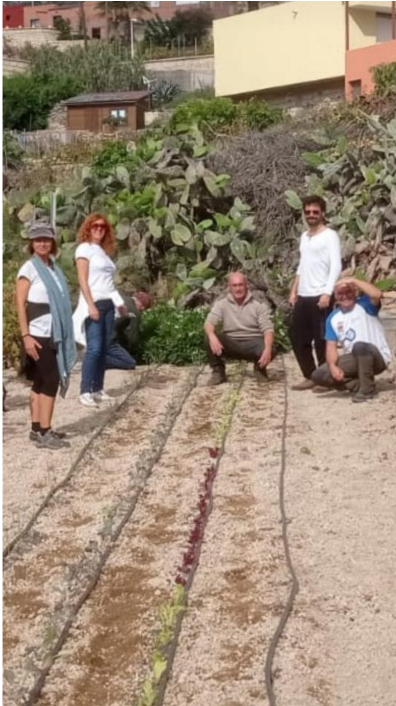
Finca de los hermanos Un dilema a resolver La Pm y No corramos demasiado La Pm