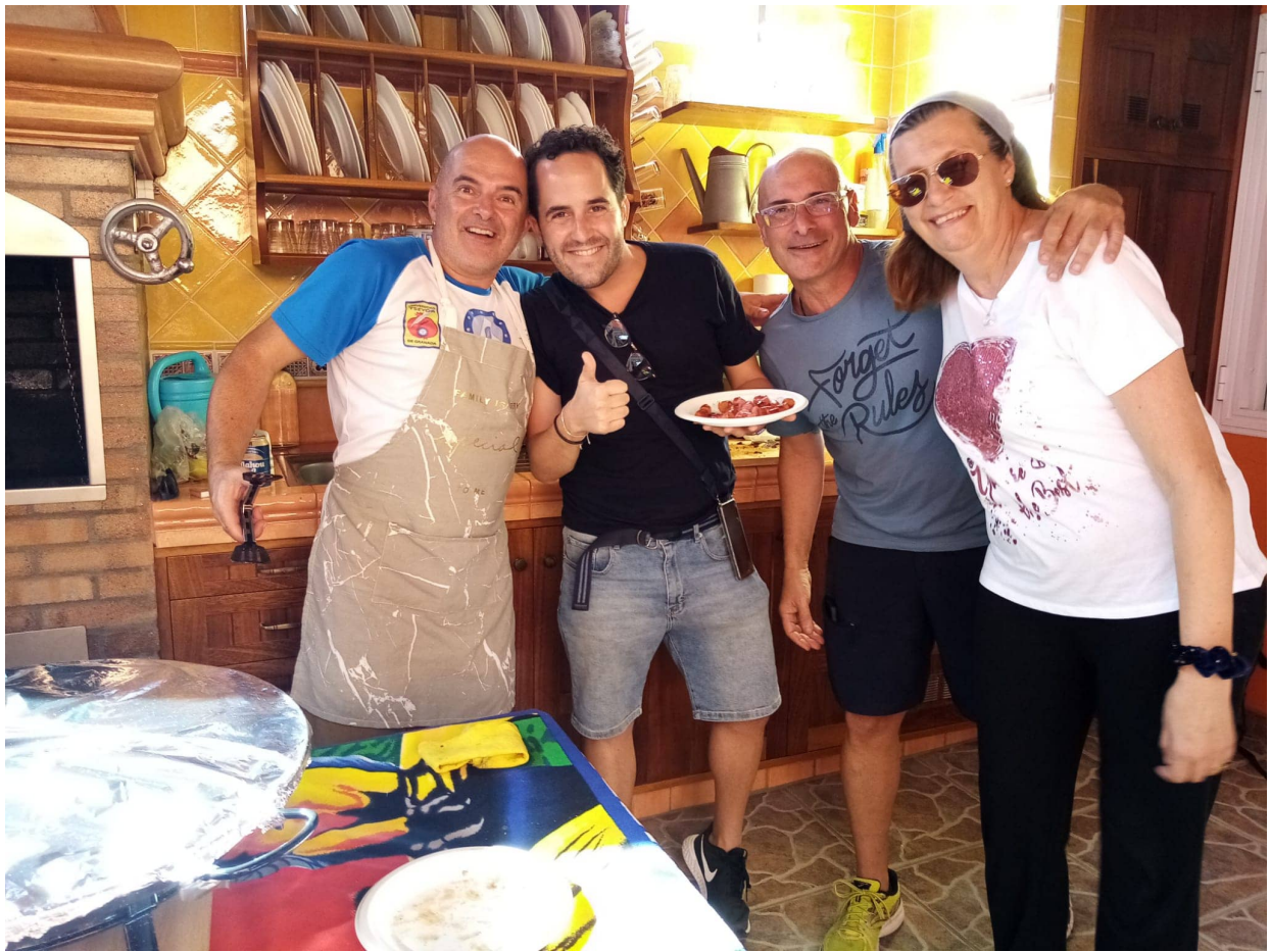
El hermano Lo dicho en frente La Pm celebra sus 33 cumpleaños