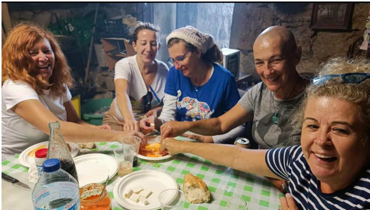
"Casa cueva" para el almuerzo