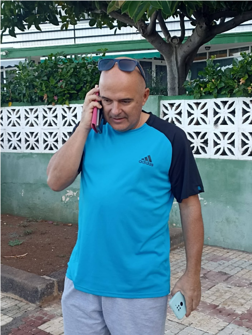
Nos comunican que los HHMM pueden intervenir por la tarde