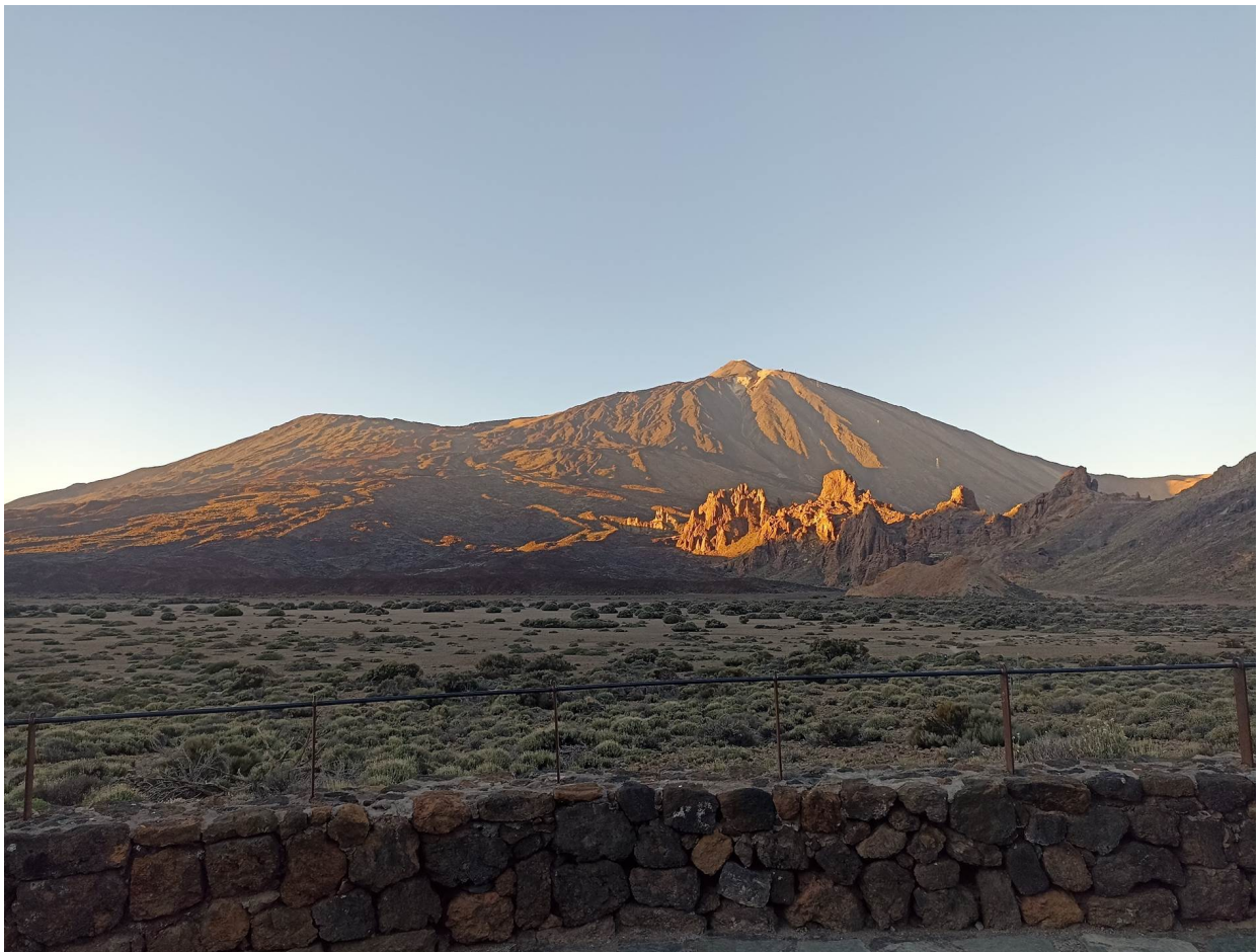
Valle de Ucanca