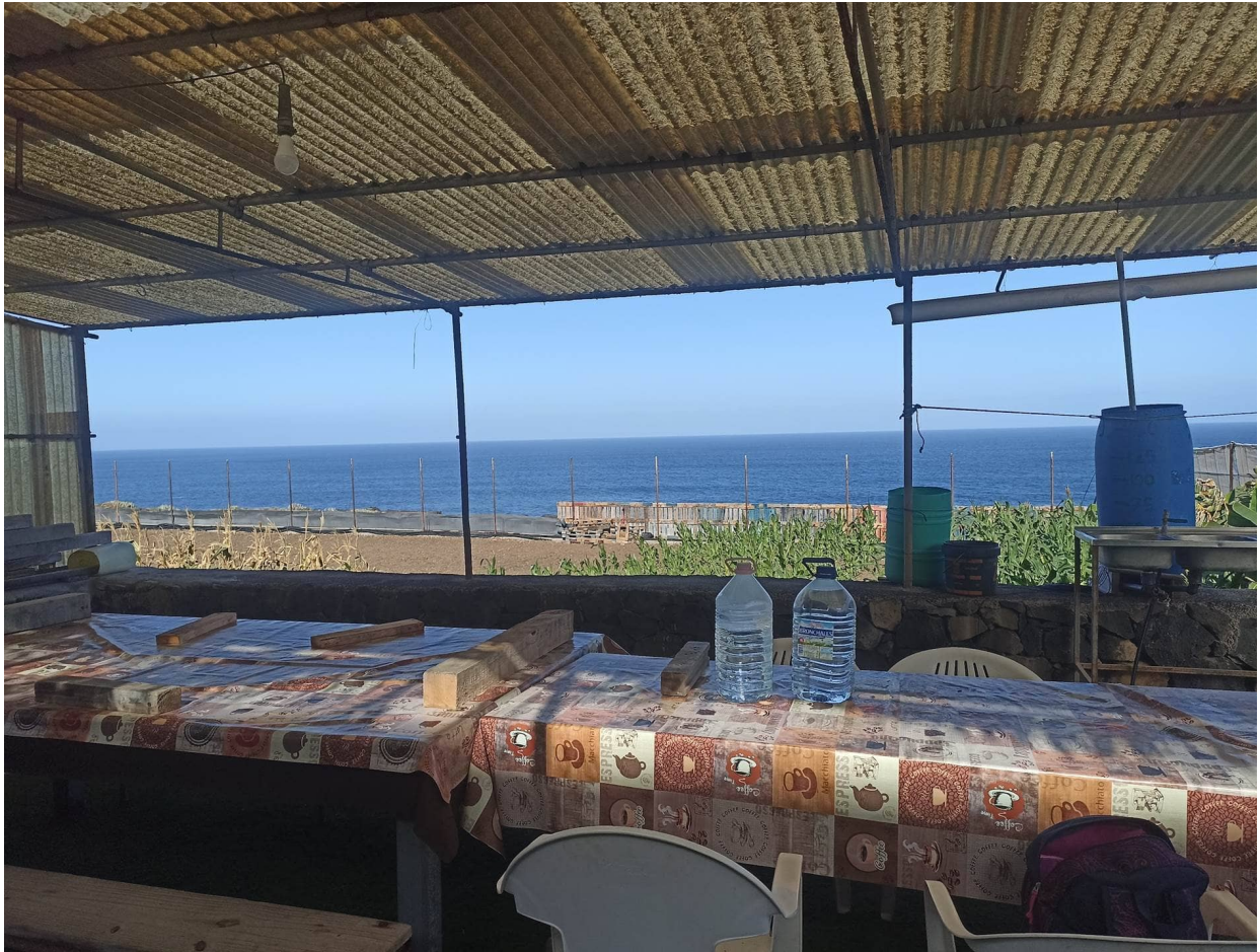
Finca "La cueva de la Negra"