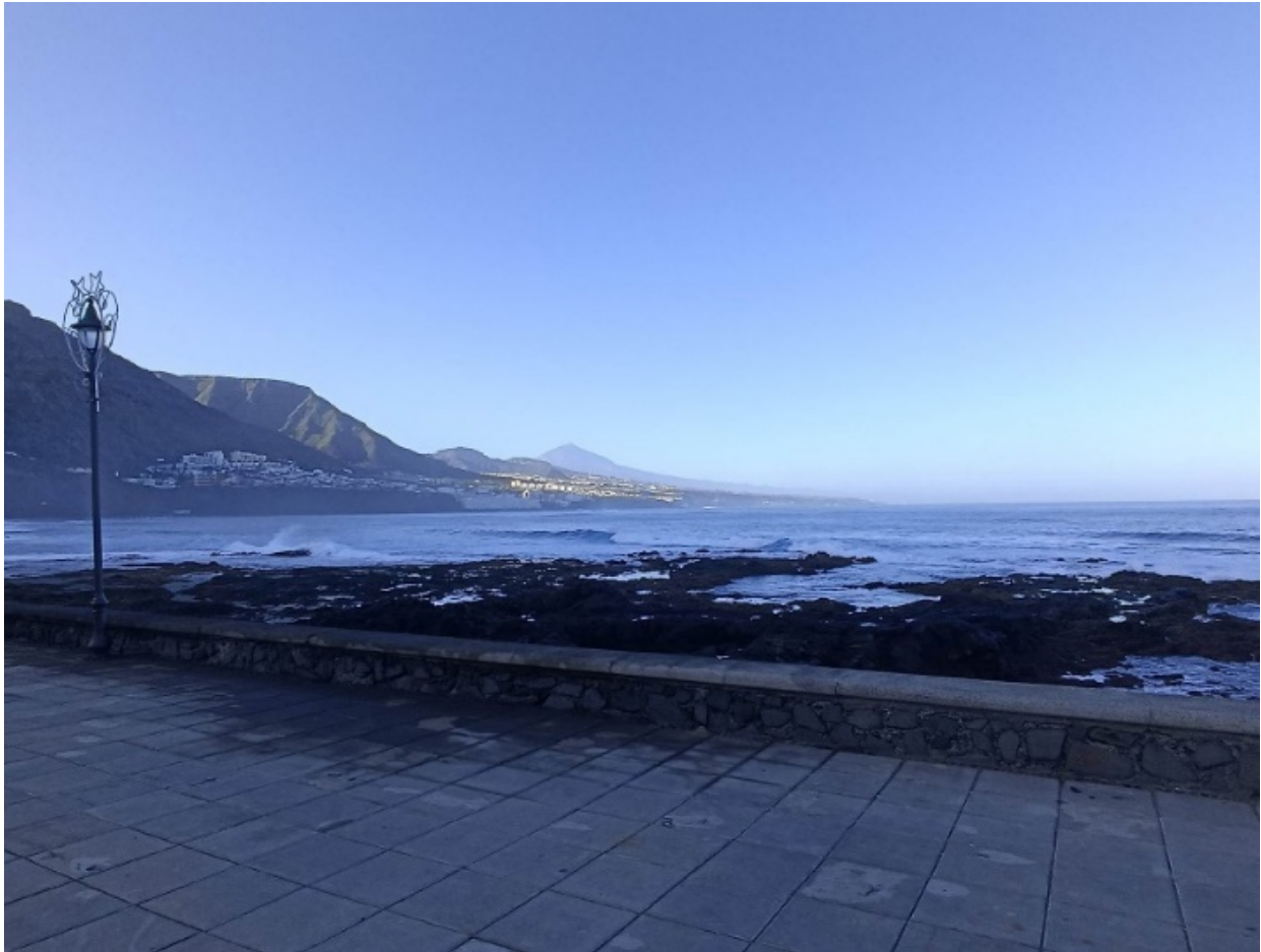
Punta del Hidalgo