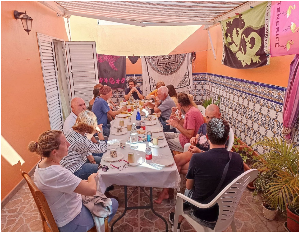
Fin de Convivencias