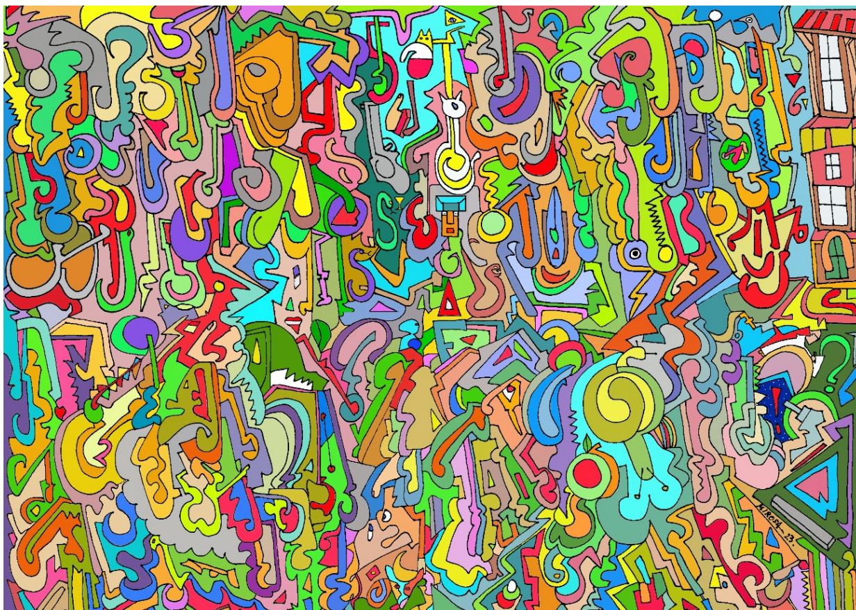
Puzle de FractalOm 13 Convivencia de la Casa Tseyor Barcelona