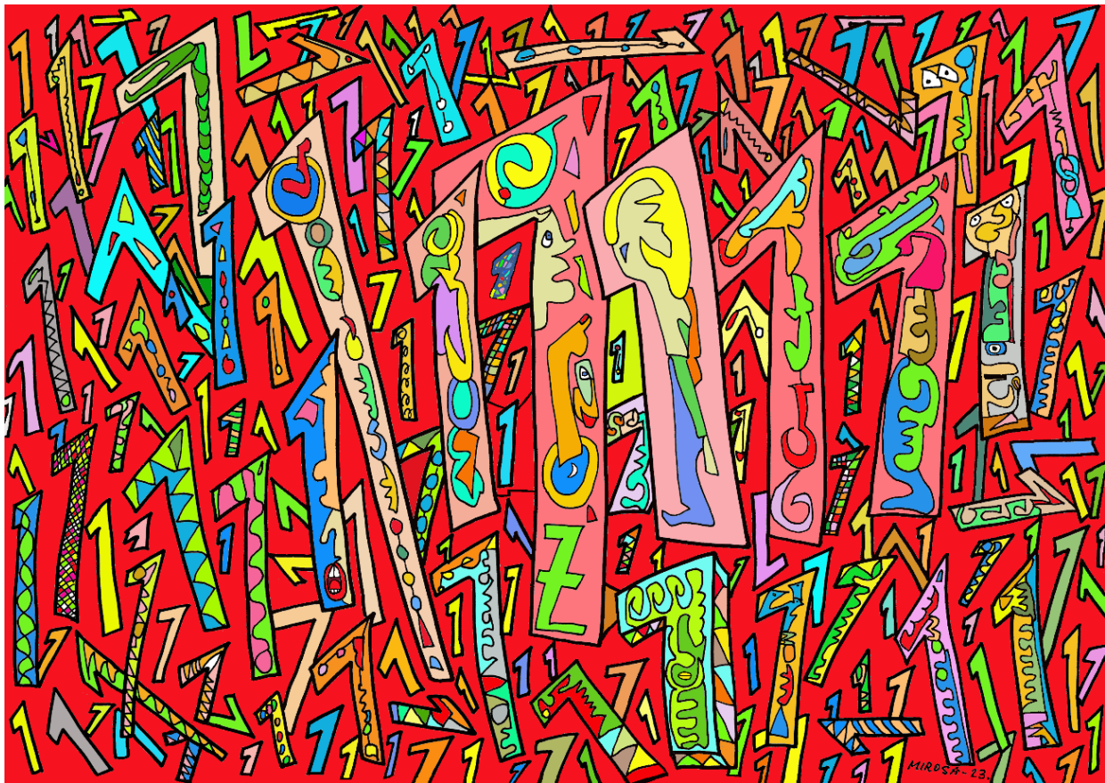
Puzle de Fractal Om 14, 1 Beh – 1101

Observad la naturaleza, observaos a vosotros mismos primero, ved cómo funcionáis, ved cómo os movéis, cómo pensáis, cómo accionáis, y ahí os daréis cuenta de que el 1 está en vosotros. El 1 está en la mujer y en el hombre, en el sexo masculino y femenino, en el positivo y el negativo, en una ecuación, indudablemente necesarios los dos.