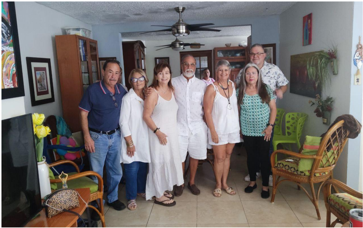
De izquierda a derecha: Renuévate La Pm, El Descubrimiento Hoy La Pm, Olvida el Pasado La Pm, Fuerte como El Roble La Pm, Dadora de Paz Pm, Con Ganas de Vivir La Pm y Caso Cerrado La Pm, posando con la Belankil de Casa Tseyor Puerto Rico, Dadora de Paz Pm, después de la iniciación.