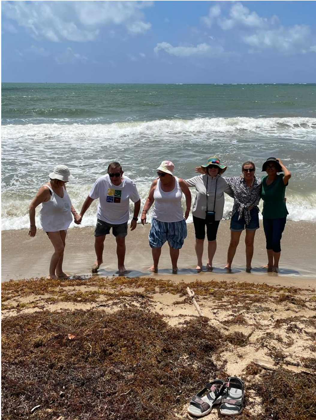
Fotos de emisarios escudriñando el cielo unas y otros poniendo los pies en remojo, en la playa de Guayanés-Yabucoa-Puerto Rico