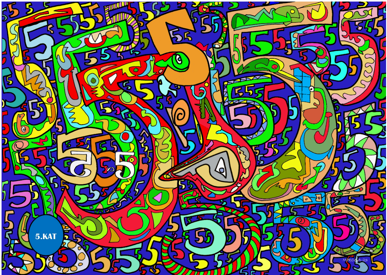
Fractal Om 5 KAT