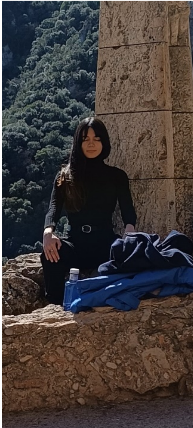
Ostracita meditando en Montserrat el 1º de marzo de 2024. La imagen central pertenece al libro Los Guías Estelares y fue pintada por Puente en 2015