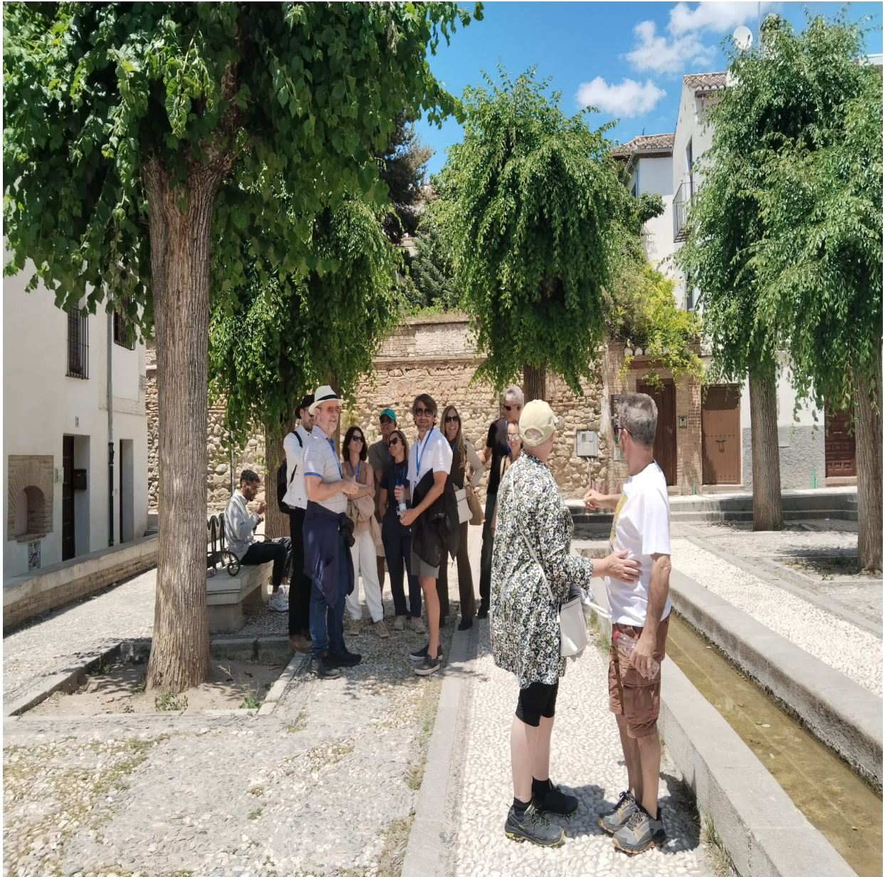
Los pasajeros de la nave son observados por Especial de Luz La Pm y Oro en Polvo La Pm en un conato de acercamiento