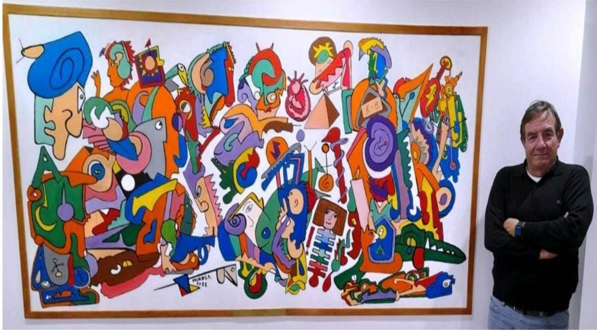
Mural pintado por Punte en el que aparece un tridáctilo peruano y figuras de diferentes culturas: hindúes, mesoamericanas...

1 La verdadera historia de las momias tridáctilas de Perú. Fueron en total cinco ejemplares hallados entre las ciudades de Palpa y Nazca, muy cerca de los geoglifos. Los especímenes que hoy se encuentran en la Universidad San Luis Gonzaga de Ica (UNICA) fueron catalogados en el 2017 como 'el gran descubrimiento arqueológico del siglo XXI' debido a que algunos pseudocientíficos sugirieron que se trataría de 'alienígenas'. Las momias exhiben tres dedos en cada mano, cráneos alargados y torsos estrechos**,** lo que lleva a algunas personas a especular que podrían ser entidades extraterrestres. Además, se plantea la teoría de que las Líneas de Nazca, representaciones de animales, plantas y formas geométricas trazadas en la superficie terrestre, fueron hechos por seres de otro mundo. Algunos incluso sugieren audazmente que funcionaron como plataformas de aterrizaje para naves alienígenas. Véase también el com. 1144.