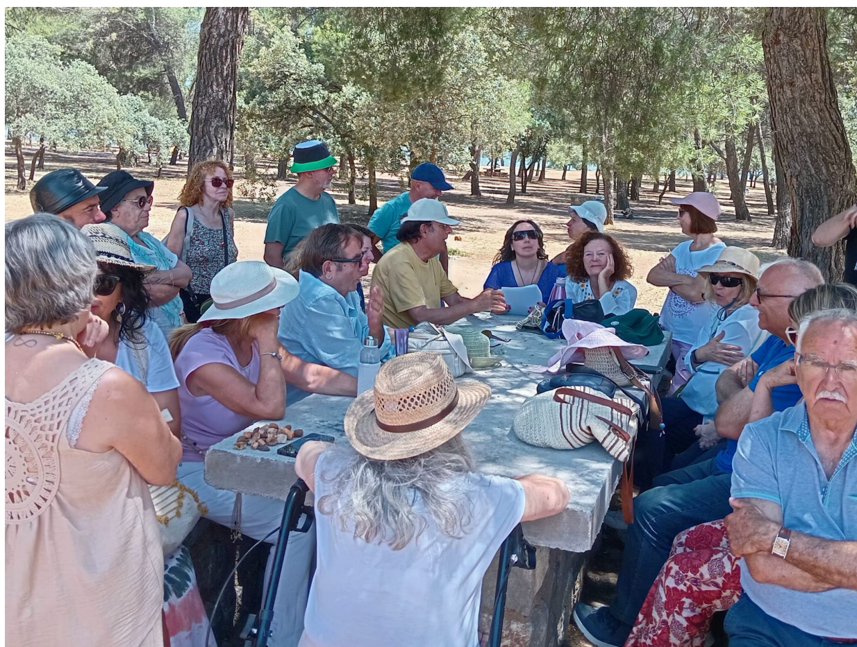
Leyendo el comunicado 1388 en el Llano de la Perdiz

Hoy hemos visitado el paraje natural del Llano de la Perdiz, lugar histórico de alertas ovni, donde hemos hecho una meditación y la lectura y comentario del comunicado dado ayer, el 1388 La revelación. Habéis hecho un gran esfuerzo por estar aquí. Hemos almorzado en Pinos Puente. Por la tarde, hemos acabado la lectura y comentario del comunicado citado, hemos realizado el Púlsar Sanador de La Libélula.