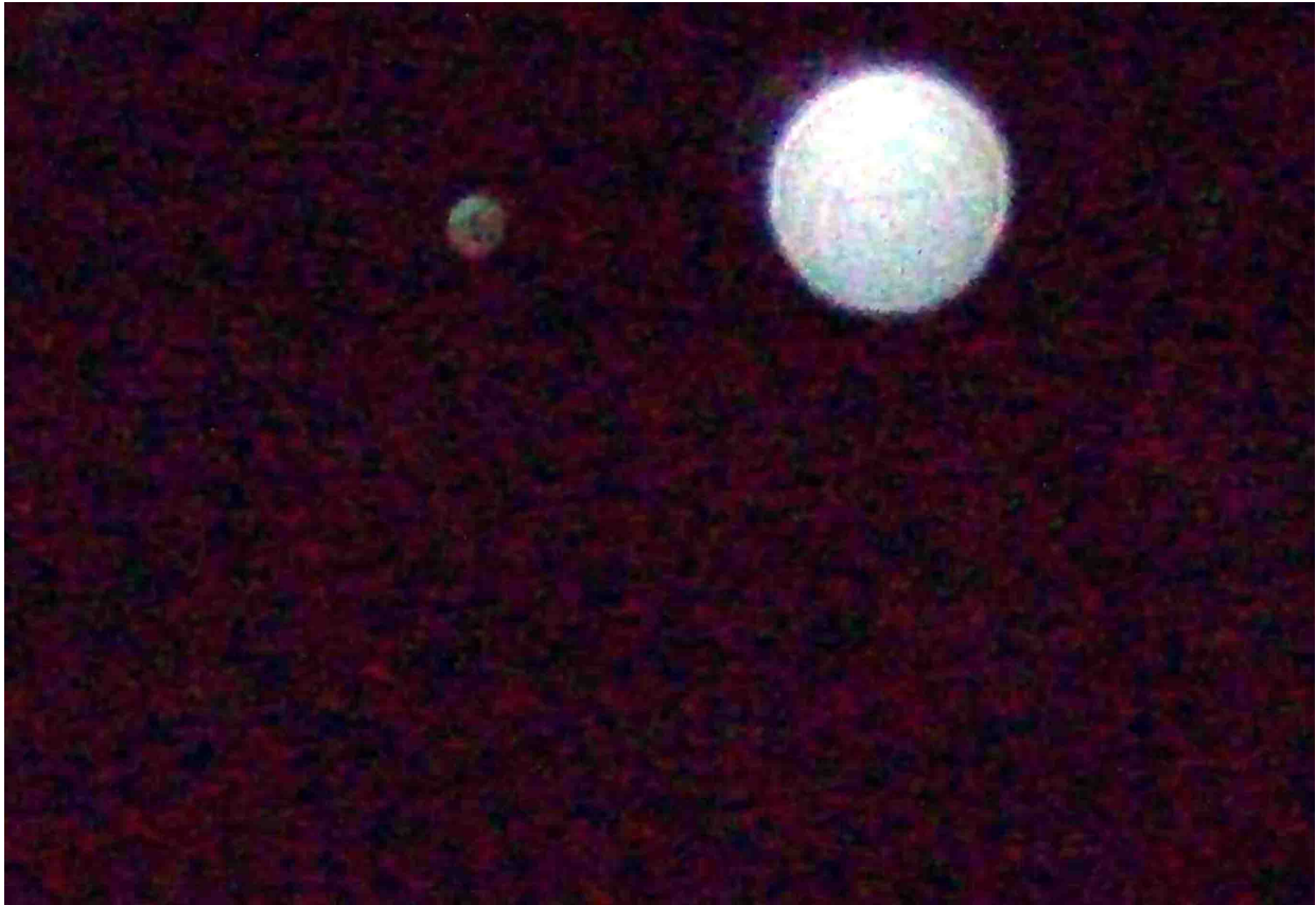
Gran orbe en Granada, después de la reunión del Consejo de los Doce, y en el que se aprecia un bello rostro.

En este día nos hemos reunido el Consejo de los Doce para constituirnos como tal y debatir una serie de temas, entre ellos el compromiso y la búsqueda del Pueblo Tseyor.