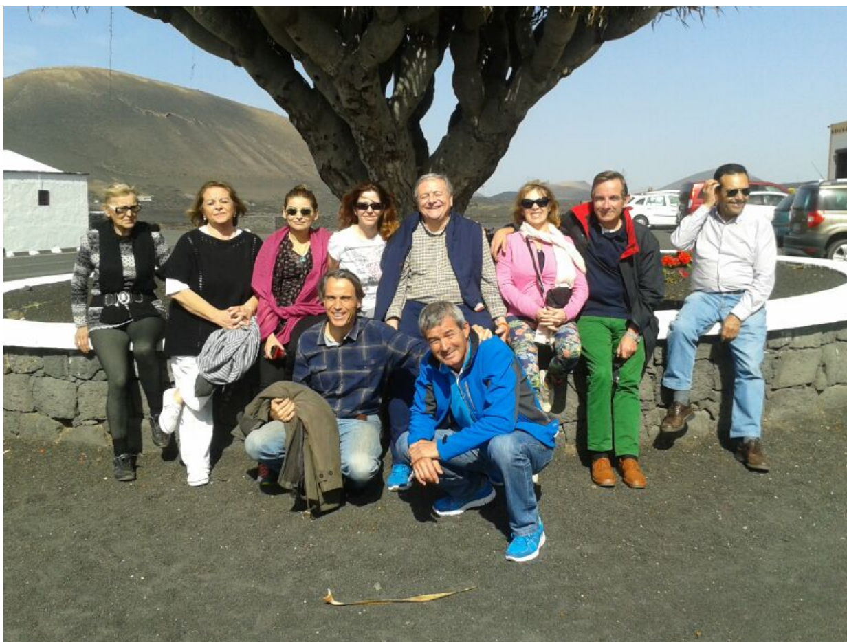
Un alto en el camino hacia el volcán de la abducción. Lanzarote. 14/02/2014