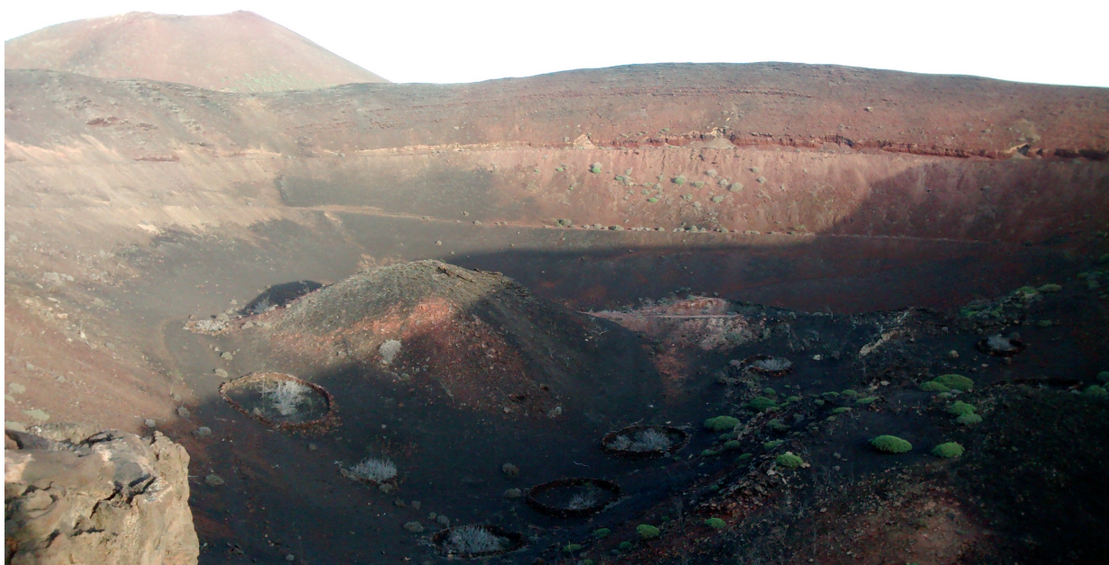
Volcán de la Abducción. Lanzarote. Islas Canarias. 14/02/2014