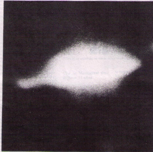
Foto inédita de un supuesto OVNI

Las últimas reuniones en lo alto de Can Massana han llegado a congregarse hasta más de 1.500 personas que han visto claramente «OVNIS» que dejan una estela gaseosa blanquizca