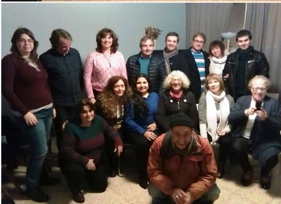
Despedida del año en Puertas Abiertas