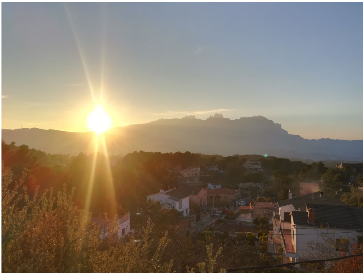
El sol poniente en la montaña de Montserrat, se aprecia una esfera a la derecha