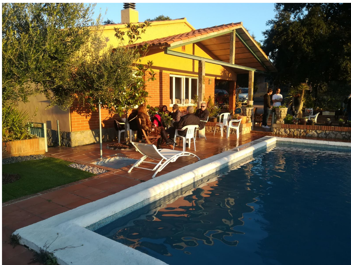
El grupo a la hora de la puesta de sol