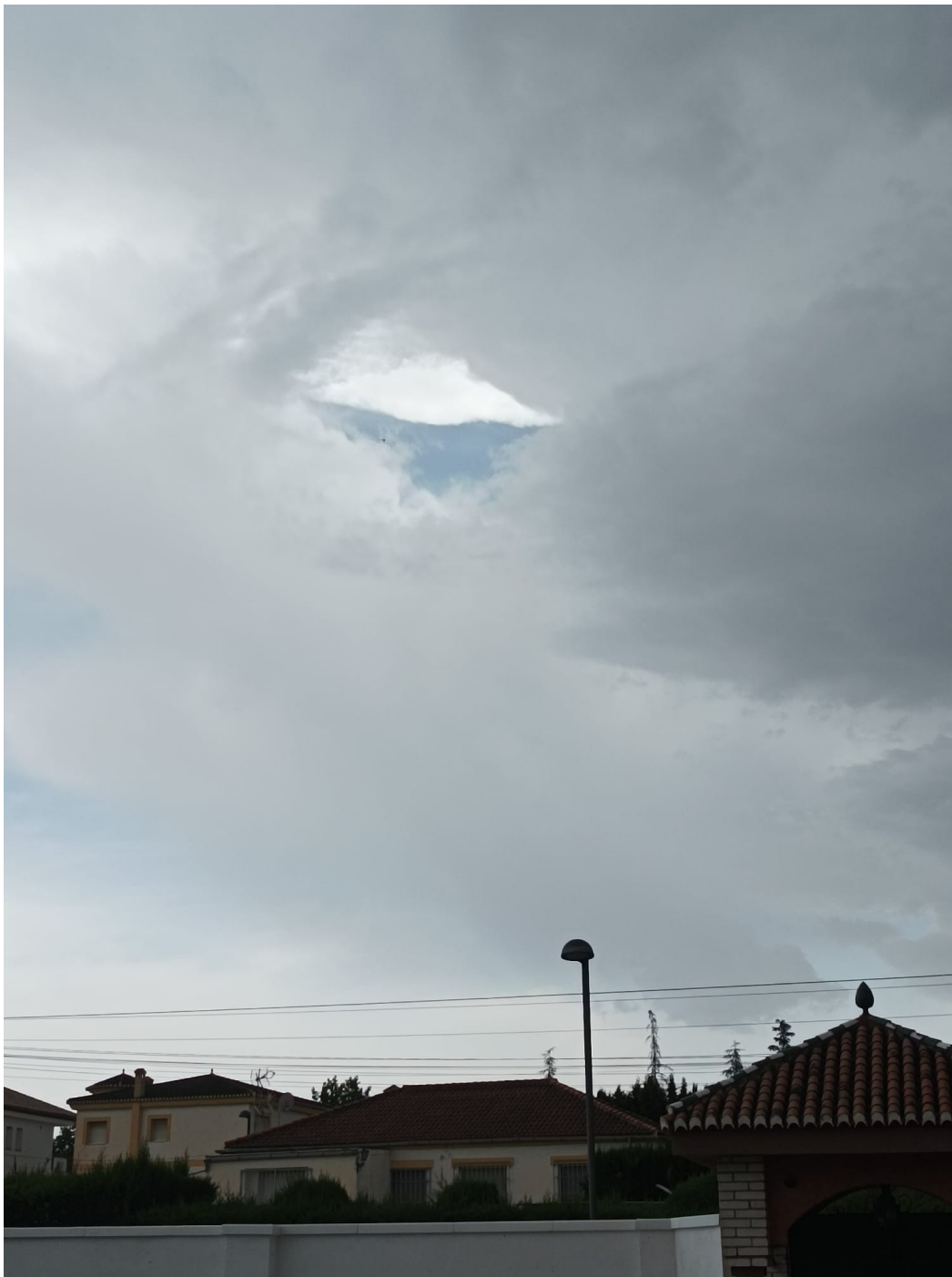
Fotografía tomada hoy en Granada, se aprecia una nube en forma de pirámide invertida