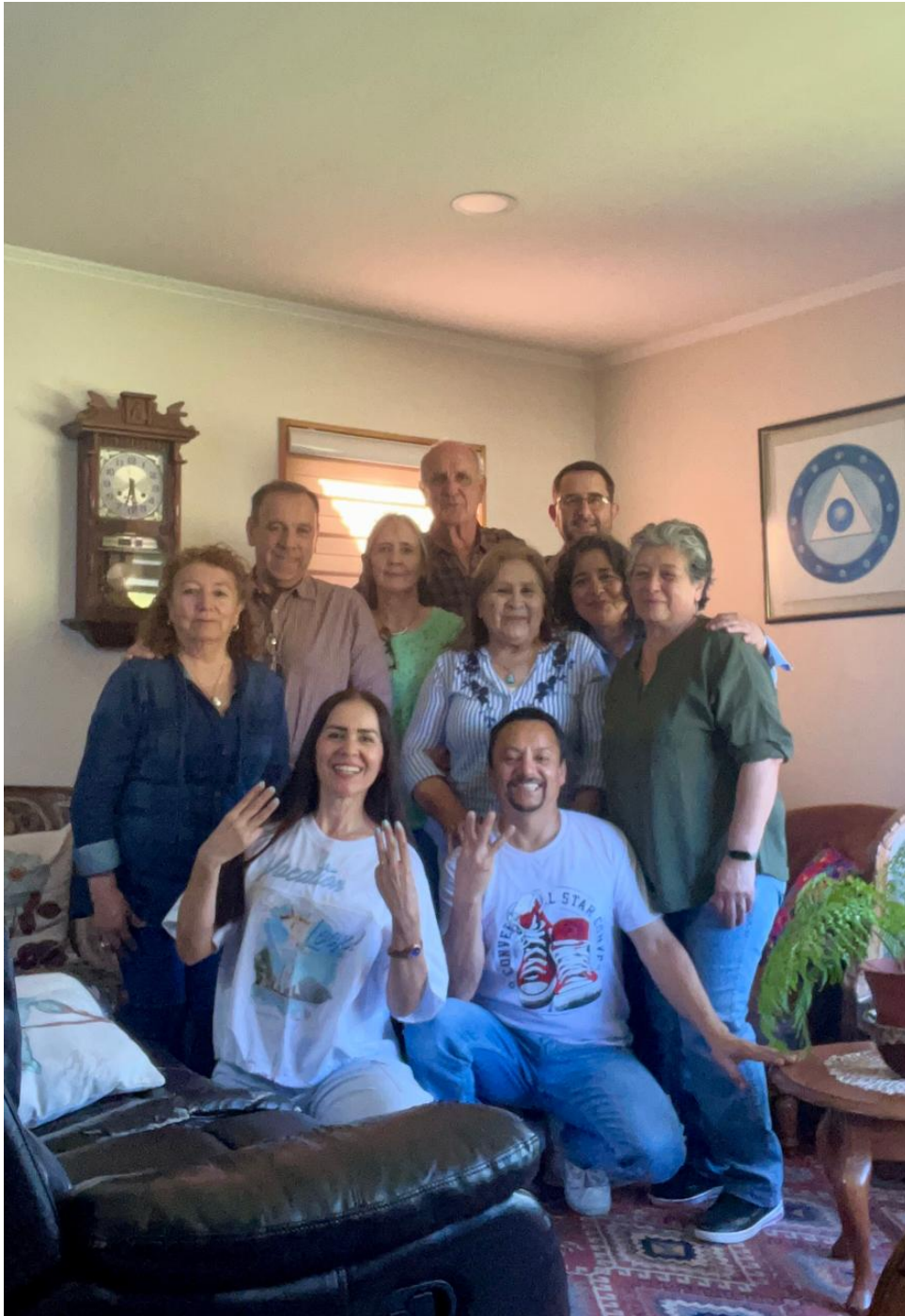
De izquierda a derecha Somos Sinceros La Pm, Donde Quieras La Pm, Guardando Fuerzas La Pm, Vencer Primero La Pm, Belankil Un Trato Amable La Pm, Vecinos La Pm, No Creas en Algoritmos La Pm, sentados Asombroso La Pm y Lo Vas A Resolver La Pm