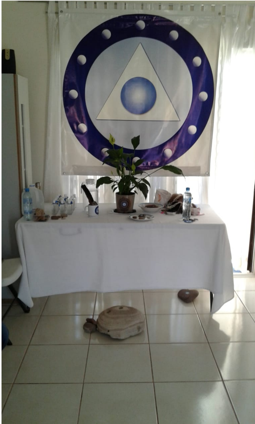
Sala del Muulasterio Los Máak de Mazatlán. En espera de la ceremonia de energetización