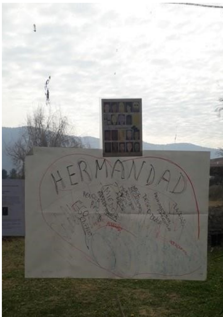
El cuadro que trabajamos en el taller de Unidad: Hermandad

Luego del desayuno, realizamos un Púlsar Senador de Tseyor, Nos preparamos todos para efectuar el taller de Hermandad que nos preparó la hermana Un Leve Suspiro, con la cooperación de la amada hermanita Generadora de Luz la pm. Cooperó con el material didáctico.