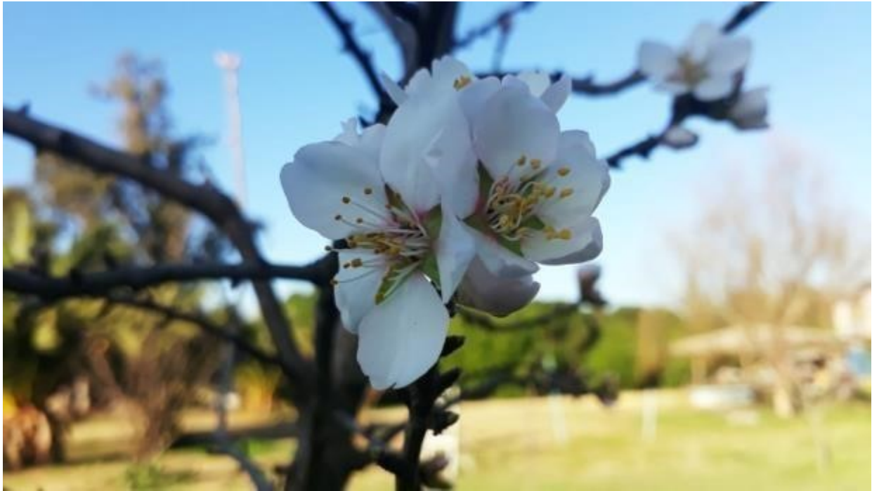
Flor de almendro.