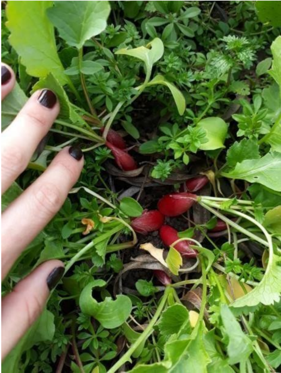
Rábanos de la huerta.