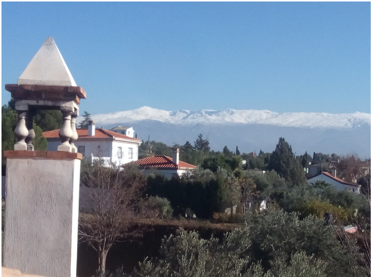
Sierra Nevada vista desde el Muulasterio Tseyor La Libélula

En la reunión de hoy viernes, hemos estado comentando en la sala del Ágora del Junantal las experiencias y trabajos que estamos realizando en estas convivencias. Habíamos pedido a Shilcars que nos diera un cuento de Navidad, como tantas veces ha hecho en las convivencias de diciembre en La Libélula, y nuestro hermano mayor nos complació ofreciéndonos el siguiente relato.