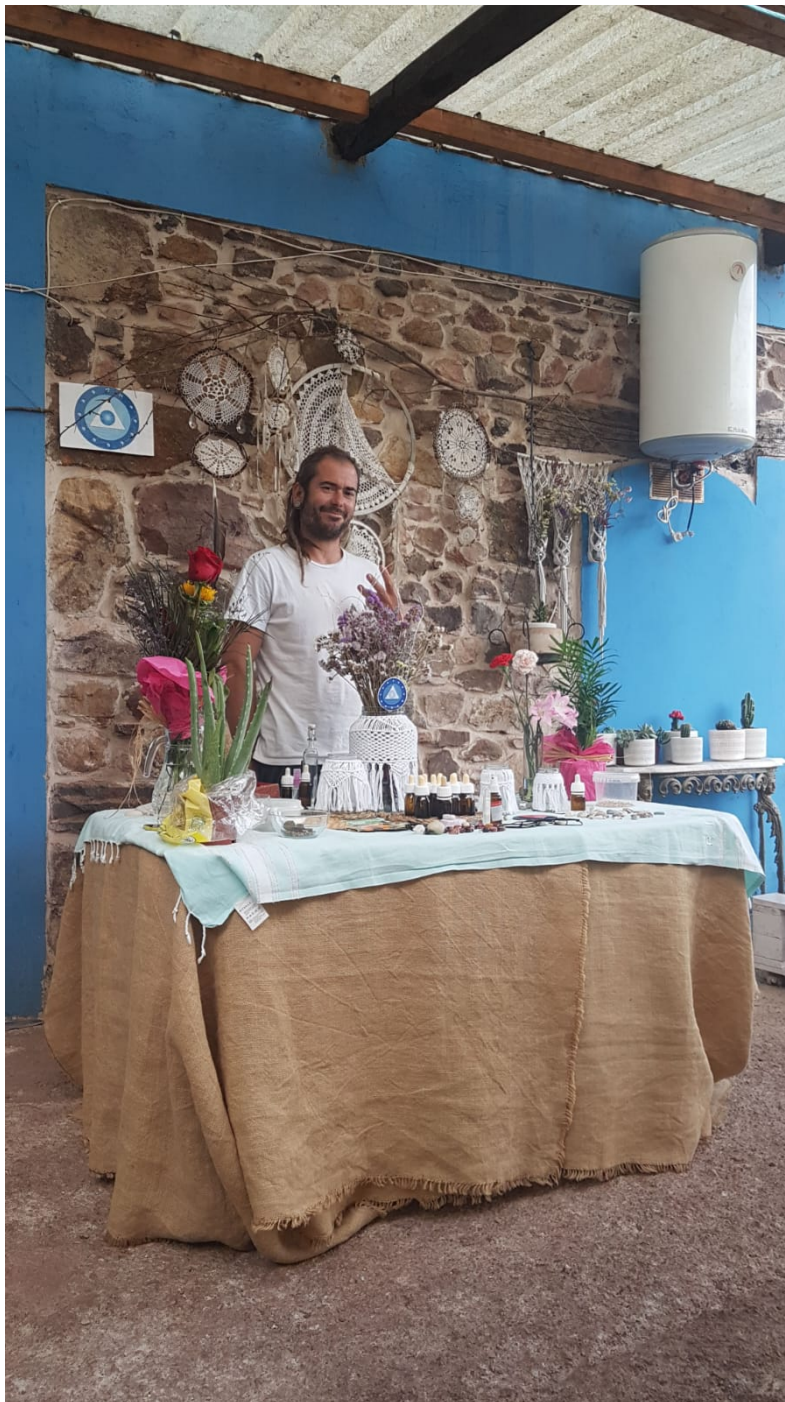
Lo Tienes Todo La Pm, delegado por la Junta de Piores para llevar a término la presente ceremonia de energetización en Asturias.