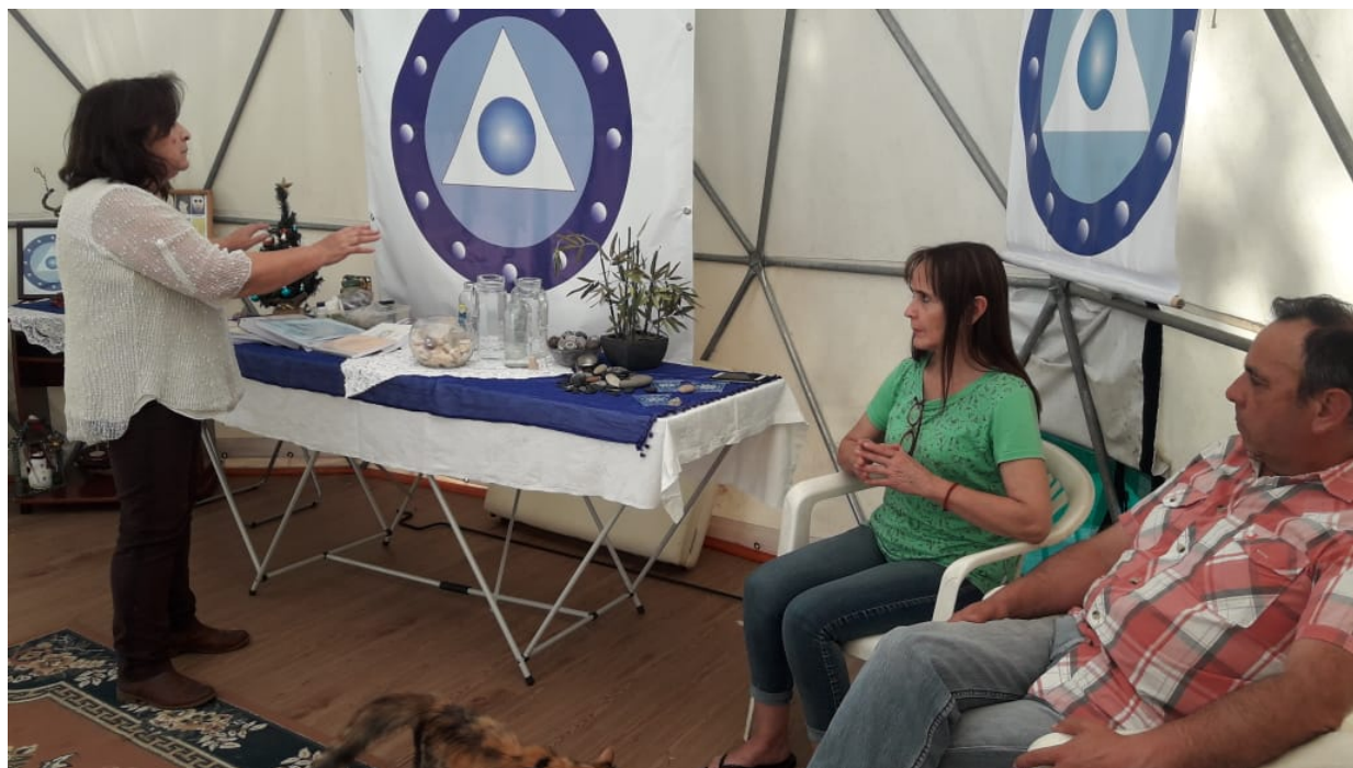
Belankil Casa Tseyor de Maquehue, Un Trato Amable La Pm, durante la ceremonia de energetización, a su lado Guardando Fuerzas La Pm, y Donde Quieras La Pm